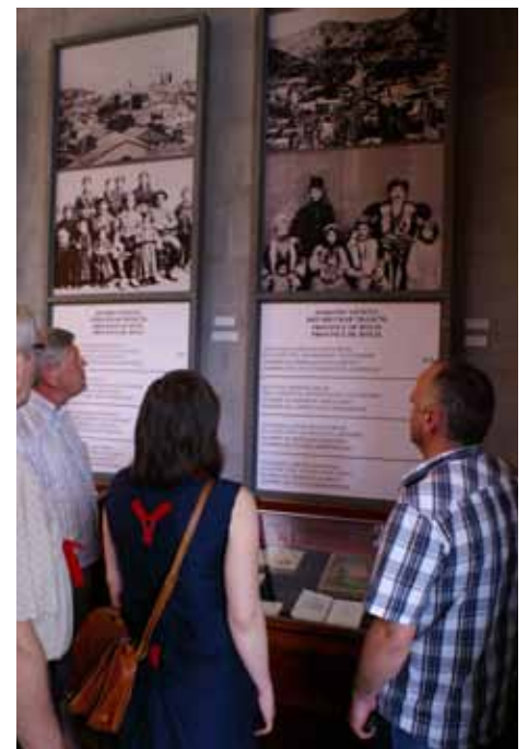
Sterke bilder og historier i museet.

Armenia er i dag en nasjon som preges av Sovjetunionens oppløsning. Mange fabrikklokaler i distriktene står tomme. Like fullt er infrastrukturen svært dårlig. Det var ganske krevende for ryggmuskulaturen å møte veinettet ute i distriktene. Mye skjer i hovedstaden Yerevan, men så fort man forlater hovedstaden er det mye i forfall. I samme periode som Sovjetunionen ble oppløst, var det også et større jordskjelv som rammet nasjonen. Samtidig med at nasjonen var i en institusjonell krise, ble samfunnet lammet av en naturkatastrofe. Mye gikk imidlertid etter hvert i en positiv retning, inntil siste økonomiske tilbakegang rammet Europa. I følge våre