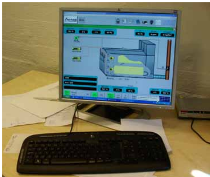
Moderne datateknikk er tatt i bruk. Tor ved PC'n der en styrer og følger med på prosessen.

1000-tallet og framover ble det stadig mer uvanlig fordi kristendommen var negativ til likbrenning.