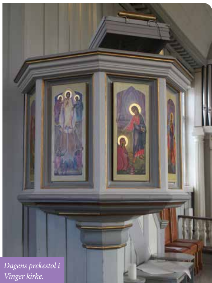
Dagens prekestol i Vinger kirke.