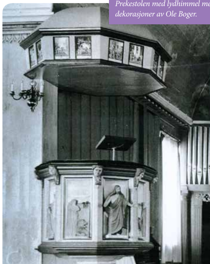
Prekestolen med lydhimmel med dekorasjoner av Ole Boger.

Det som er helt klart at Vinger kirke endret helt karakter under Devold-perioden, fra å være en lys og ganske gold kirke til å bli en kirke med mange farger og bilder. Siden begynnelsen av 1960-tallet har kirken igjen hatt mindre bilder og lysere fargesetting. I de siste årene har det vært gjort tiltak for å gjøre kirken mindre fargeløs, blant annet ved å bringe tilbake den