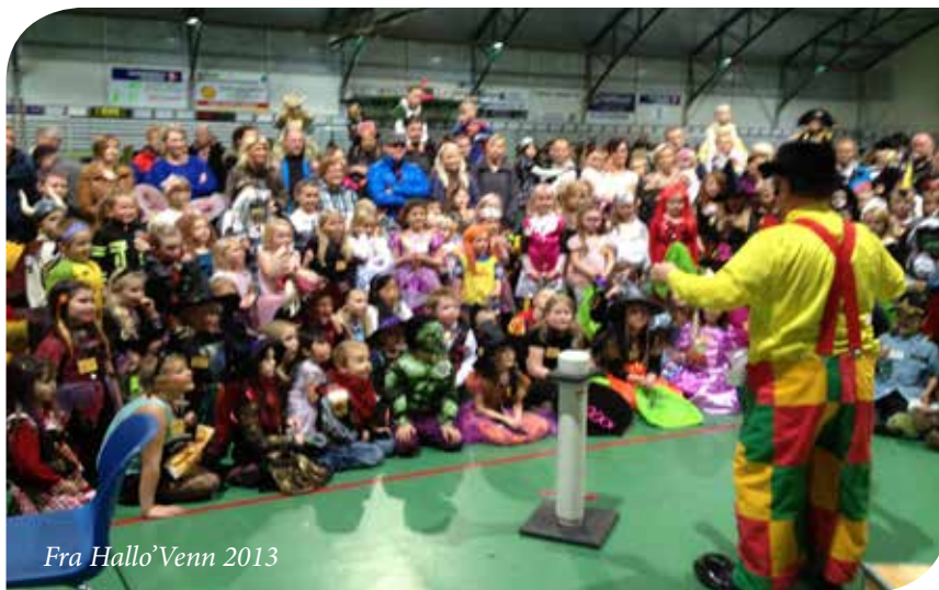
Fra Hallo'Venn 2013