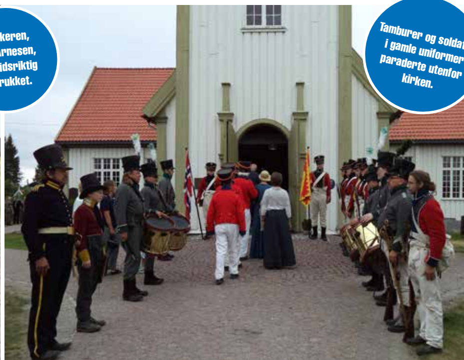
Tamburer og soldater i gamle uniformer paraderte utenfor kirken.