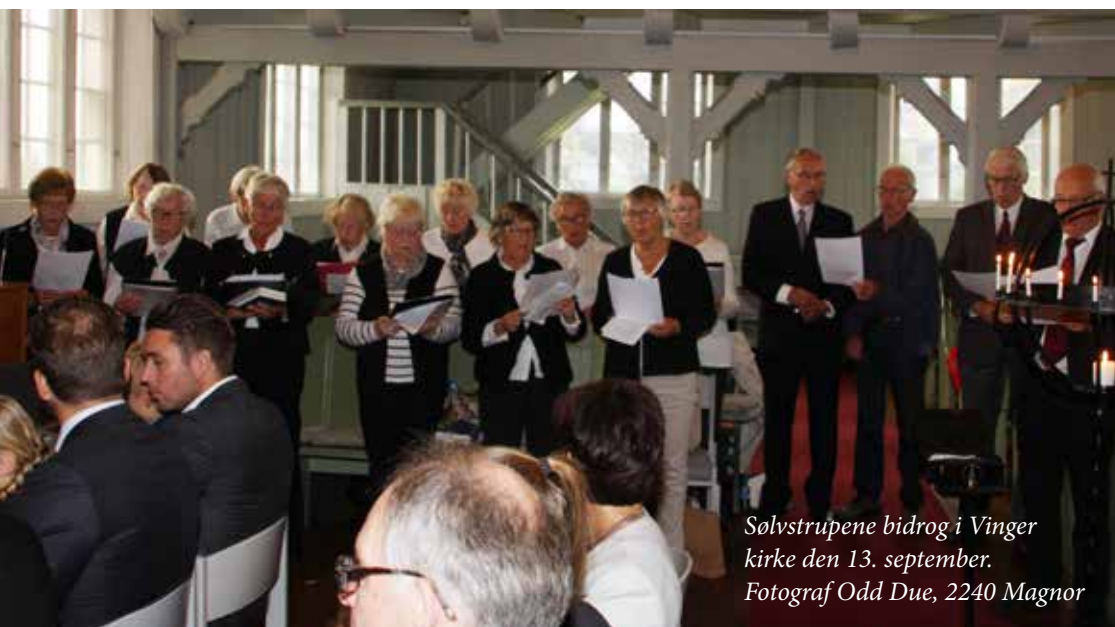
Sølvstrupene bidrog i Vinger kirke den 13. september.

Sølvstrupene ble startet i 2001 på initiativ fra Vinger menighetsråd, som så det som ønskelig å starte et korarbeid for pensjonister. Organist Kaare Nergaard som nylig var blitt pensjonist tok på seg oppgaven å være musikalsk leder. Koret vokste raskt og har gjennom årene hatt mange opptredener. Naturlig nok har koret også mistet mange trofaste medlemmer og det er behov for stadig rekruttering for å holde koret i gang. Koret er også et sosialt fellesskap, uten opptakskrav.