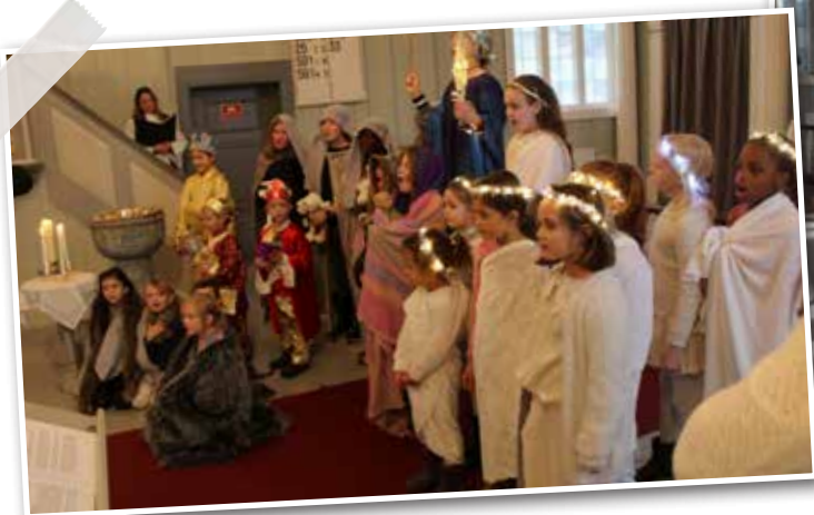
Lys Våken gudstjenesten med julespill av King Kids med søndagsskolebarna.