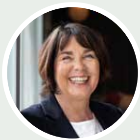
Eldre ombud Bente Lund Jacobsen holder foredrag om viktige temaer for eldre i Rådhus Teatret 31. mai, etterfulgt av Beatles-nostalgi, kaffe og vafler.