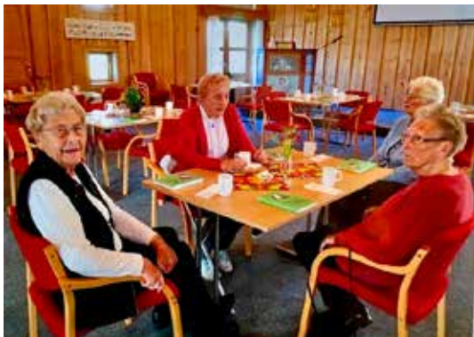
Frå protokollen.

-Ragnhild og Ellen. I tillegg til husmoryrket hadde Marie ulike jobbar utafør heimen. Samvirkelaget i Treungen var ein av dei fyrste arbeidsplassane hennar. Medan ho hadde arbeid der, braut det ut fleire tilfelle av polio. Marie fekk då beskjed frå leiinga om å reise heim att til Kviteseid. Marie fortel at det var fleire som døydde av polio den gongen.