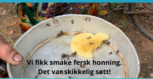
Vi fikk smake fersk honning. Det var skikkelig søtt!

Jeg ble grepet av troen denne damen og mannen som tar seg av barna viste. På tross av å ikke ha mye selv, så hadde de stor omsorg for barna i landsbyen. De lener seg på Gud i håp og tro på at Han skal forsørge dem med mat og det de trenger. Det var ganske fascinerende å høre, denne damen trodde på Jesus og hadde et stort hjerte for disse barna og viste tro på Guds forsørgelse, men slik som det sikkert er for alle, så trenger vi noen ganger hjelp til å tro fordi situasjonen kan se umulig ut. Noen ganger da det var vanskelig for denne damen å tro hvordan de skulle ha nok mat til alle, minnet mannen hennes, som ikke har tatt i mot Jesus, henne på at Gud har sørget for at de har fått nok mat før, og at Gud vil ta seg av dem nå også!