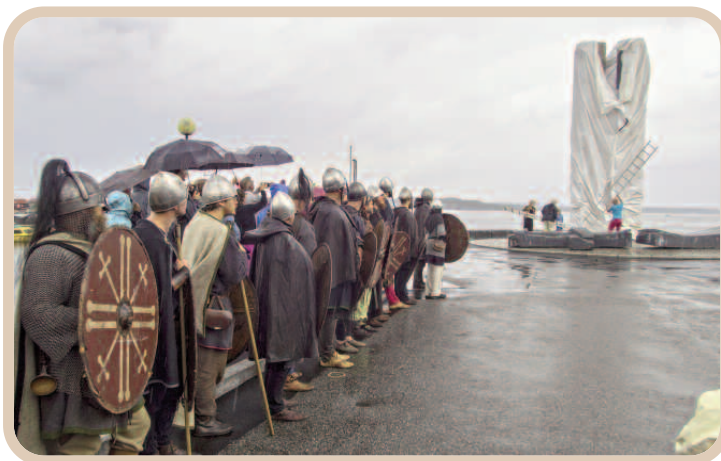
Vi venter på avdukinga.

Men kunne Gud bruke Olav den gangen, tross alt, går det også an å hente frimodighet her: Da kan han også bruke oss. Det går ei tusenårig linje fra Olav til oss, en stafett som vi tar over.