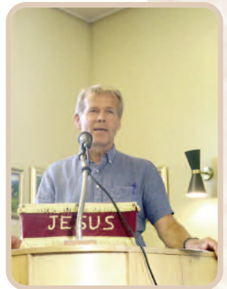
Biskopen hadde fått det takknemlige temaet "Fri og bevare meg vel!"