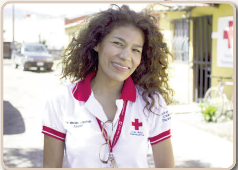
Hjelpearbeider i Guatemala

Røde Kors er mange steder den eneste hjelpeorganisasjonen som slipper til med humanitær bistand, og har gjennom lokale frivillige tilgang til dem som ellers ikke får hjelp. Gjennom TV-aksjonen skal flere mennesker i krig og konfliktområder få livsviktige medisiner, helsehjelp, rent vann og mat. Behovet er enormt, og hvert bidrag er med på å redde liv.