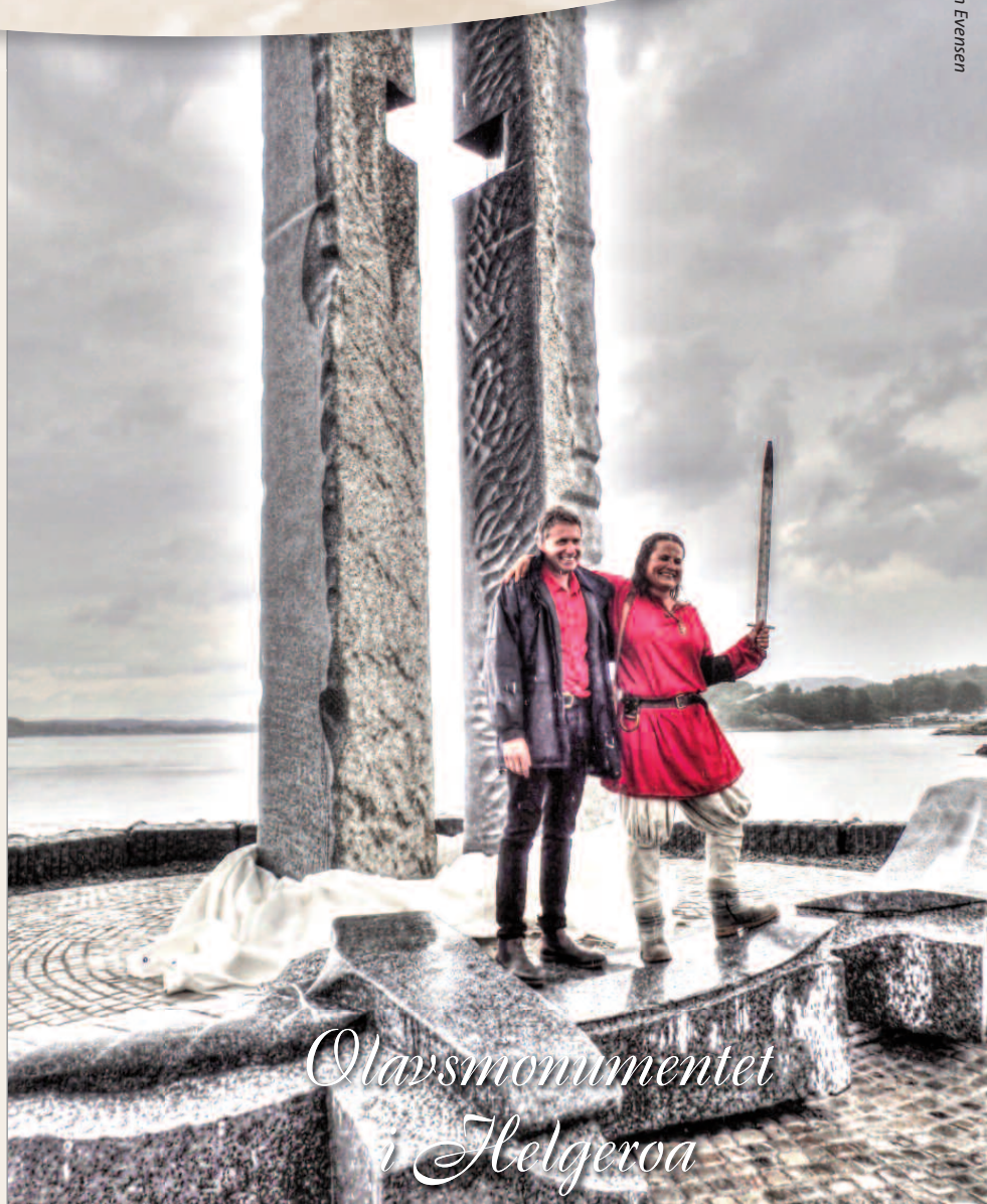
Olavsmonumentet i Helgeroa