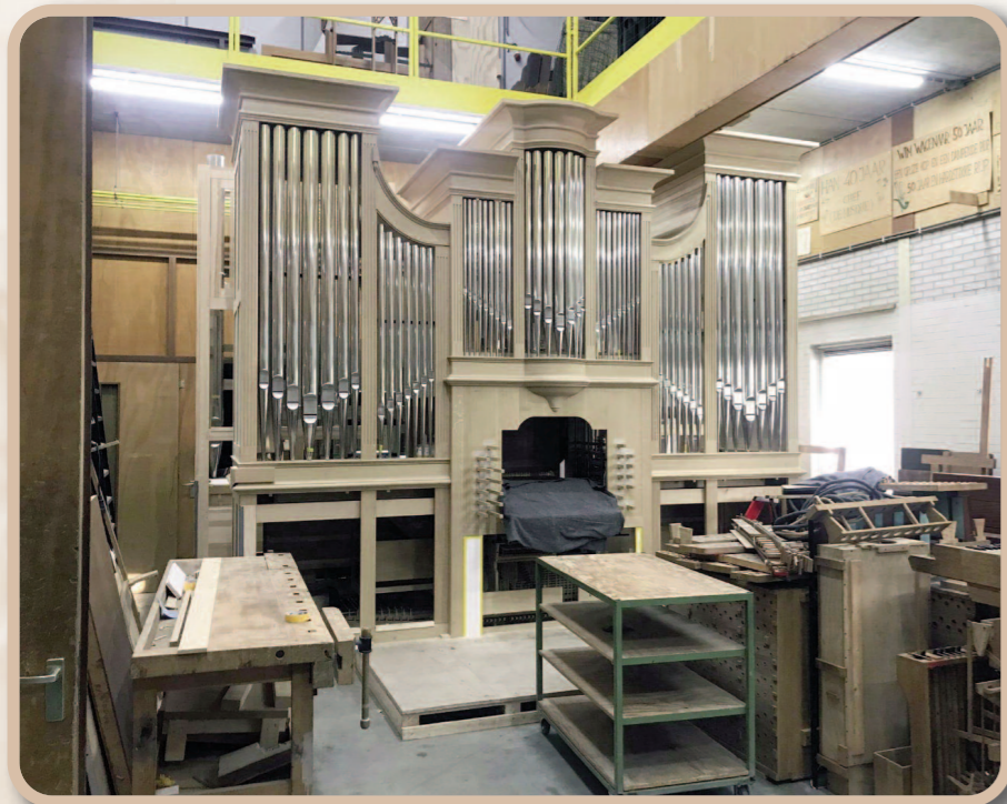
Foreløpig er orgelet i verkstedet.

Mange har arbeida i mange år for å skaffe nytt orgel til Tanum kirke. Og nå er det ikke lenge til det skal innstalleres! I månedskiftet januar/februar 2022 kommer to eller tre personer fra orgelbyggeren Reil i Nederland for å montere det store instrumentet. Omtrent en måned etter skal det være klart til å males. Og så i mars april settes krona på verket: Da foretas intonasjonen, det som fagfolk kaller "den endelige tilpasning av den enkelte pipes klangkarakter". Et orgel er jo ingen hyllevarer, det må nøye tilpasses kirkerommet der det skal