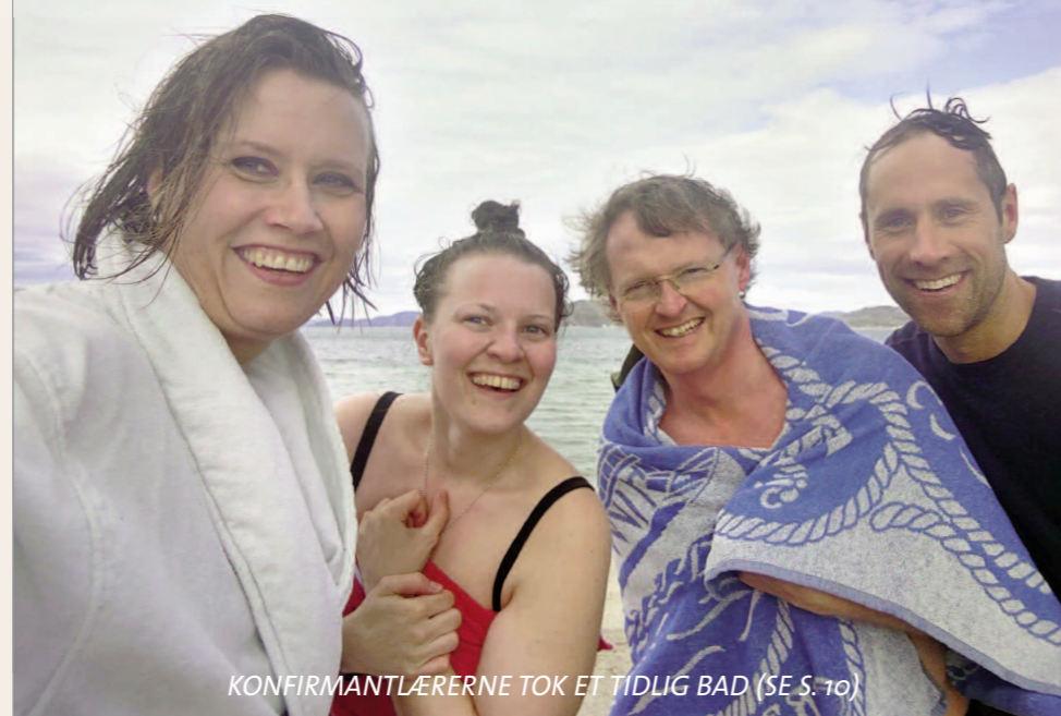
KONFIRMANTLÆRERNE TOK ET TIDLIG BAD (SE S. 10)