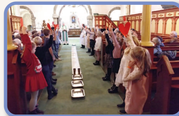
Fat med vann på golvet så tårnagentene kan sjosette bibelord.

Denne mystiske personen sendte oss ut på skattejakt rundt i kirka: Først opp i tårnet hvor vi fant ei skattkiste låst igjen med kjetting og ulike låser, som krevde både koder og nøkkel. Når vi først var der oppe fikk vi høre om rosenkransen og det amerikanske bombeflyet, og ikke minst se på kirkeklokkene våre. Sammen med skattkista lå det et nytt brev som tok oss inn i sakristiet i kjøleskapet og til maiskaker,