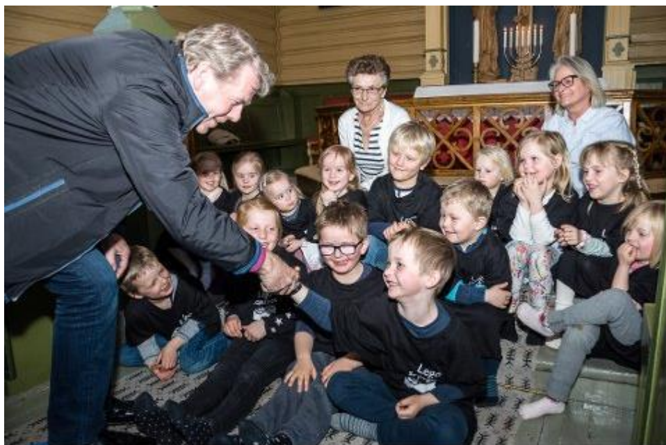
Fra bispevisitasen – Kjøse kirke