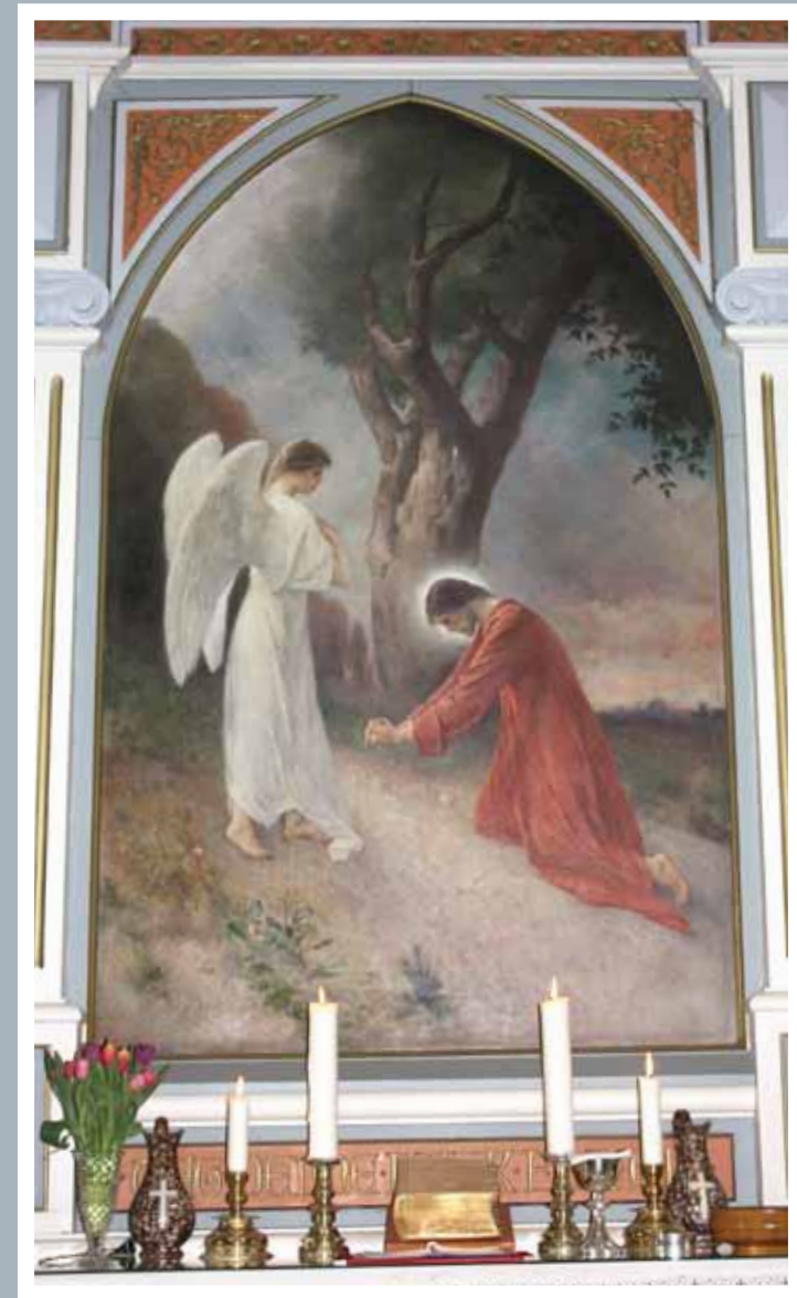
Altartavlen i Kvelde kirke.

"Min far! Er det mulig, så la dette begeret gå meg forbi. Men ikke som jeg vil, bare som du vil".