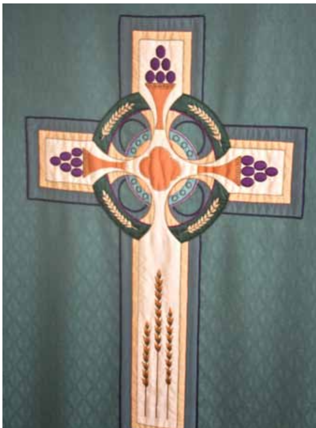
Messehagelet i Kvelde kirke.

Jeg sitter igjen med et overveldende inntrykk av en dame som virkelig imponerer med det hun har skapt. Vi kan nyte kunsten og la oss berike under gudstjenesten når vi ser på de vakre tekstilene hun har skapt.