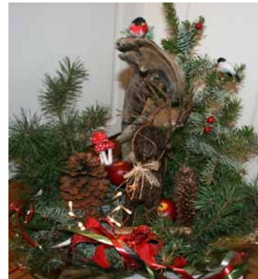
På bilde ses blom- steroppsatsen som «Hederskar» Magne Bye fikk tildelt.