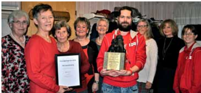
Bildet er fra overrekkel- sen av Frivillighets- prisen fra Larvik Røde Kors, 2016.