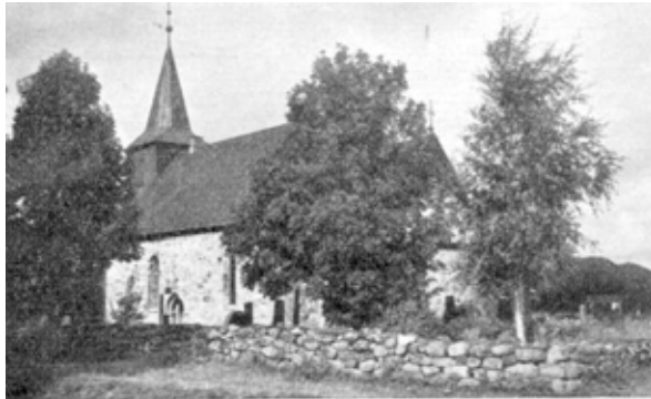
Hedrum kirke (ca.1947).

Utdrag fra de to første utgavene av Hedrum menighetsblad, oktober og desember 1947.