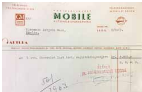
Faktura på en Chevrolet i 1963

Sommeren 1963, kjøpte han seg en 1953 modell Chevrolet, som ble påmontert en 2500 liters tank og aggregat med telleverk og slangetrommel.