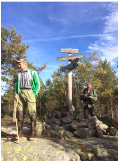
Denne dagen er gutta på Knappen.

Så hvis du vil vite mer og har lyst til å bli med, ta kontakt med Sigurd (mobil 979 64 909) eller Ragnar (mobil 976 64 480).