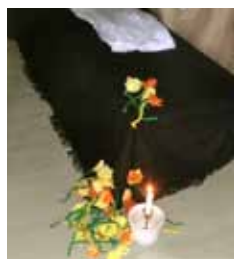
Til venstre: Påskevandring i Rødbøl barnehage. Til høyre: Den tomme grav i Kvelde kirke.