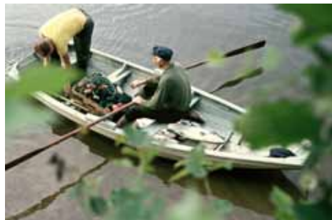
Fangst etter trekking av settegarn, Gjønnnes 1974.

I den mørkeste delen av de lyse augustnettene er det tid for å fiske ørret «på drag» i stille vann og elver inne på skogene. Spenningen, stemningen og gleden ved å gå langs et stille vann nattetid glemmes aldri. Det samme kan sies om flåtefiske på Lågen. Det er vakkert å se flåtene på Eftedal eller i Hvarnes. Et vanlig syn for bygdefolk, men for fremmede er det like eksotisk som villmarkslivet i Alaska. Ringer laksen virkelig på døra? Koker de kaffe på flåten? Er det seng i hytta?