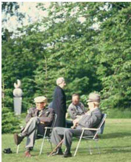
St.Hans i Prestegårdshagen 1976.

Sommeren starter med juni og rommer St. Hans og midtsommer. Døperen Johannes gav navn til solfesten. Han var predikanten og veiviseren som det er prekt om så mange ganger i våre gudshus. I Hedrum lever vi langs Lågen. Også Johannes gikk langs ei elv, selv om Jordan var liten i forhold til Lågen. Jordan er vel ikke større enn Hagneselva. Ved Jordan møtte han Jesus og sa: «Se der Guds lam som bærer verdens synd». På den lyse Johanneskvelden den 23. juni samler folk seg og det brennes bål på strender og sletter langs Lågen og ved vann rundt i bygda.