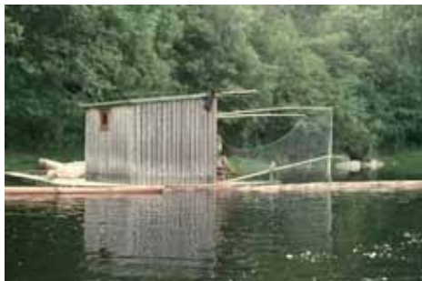
Flåtefiske på Gjønnnes 1974.