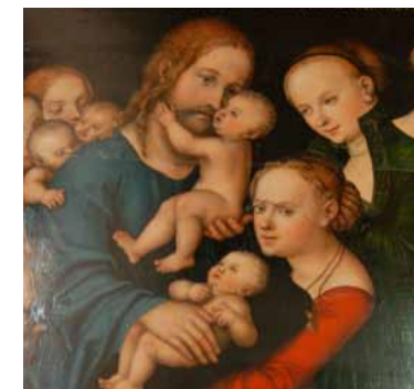
Detalj fra «La de små barn komme til meg» av L. Cranach d.e.