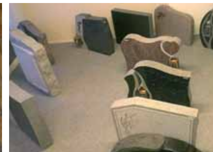
Gravsteiner fra Strandberg stein.

Fire og et halvt år etter starten er takknemlighet stikkordet for en oppsummering. Vi ønsker å rette en takk til dere som har vist oss tilliten og brukt oss som byrå. Det er godt å oppleve at vi blir godt mottatt. Jeg er også takknemlig for å kunne ha dette som arbeid. Det er noe spesielt og meningsfylt å kunne være tilstede for noen, det å kunne hjelpe litt, når noen trenger det som mest. Selv om mye av det vi møter er både meningsløst og tragisk, så skal vi være tilstede som støtte og hjelp i vonde dager.