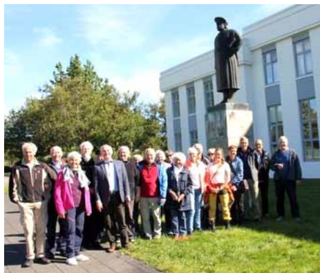
Gruppebilde ved statuen av Snorre