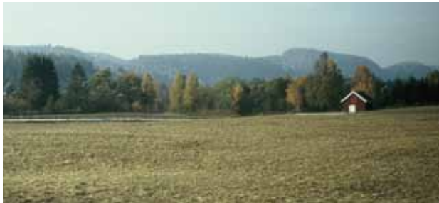
I langt over tusen høster har sandslettene i Hedrum bært fram sin grøde.

Naturåret og kirkeåret har sin faste rytme og kjennetegn. I fire små stykker rusler vi gjennom bygda, årstid for årstid.