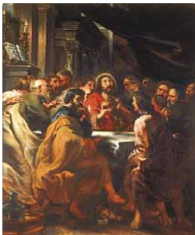
Foto av Rubens originale maleri Nattverden, for sammenligningsens skyld.

Altertavlen er utført i barokkens stil og skal være et karakteristisk arbeid for sin tid hva form og innhold angår. Man kjenner ikke hvem som har skåret altertavlen i Hedrum, men det kan være samme mester som har laget altertavlen i Heddal stavkirke i 1667. Treskjæringen regnes som et meget dyktig utført arbeid. Det samme kan neppe sies om altertavlens sentrale maleri. Ansiktene er store og grove, mens kjortlene faller i unaturlige folder. Bak signaturen H.S.B. nederst i høyre hjørne skjuler det seg en ukjent kunstner eller bygdemaler.