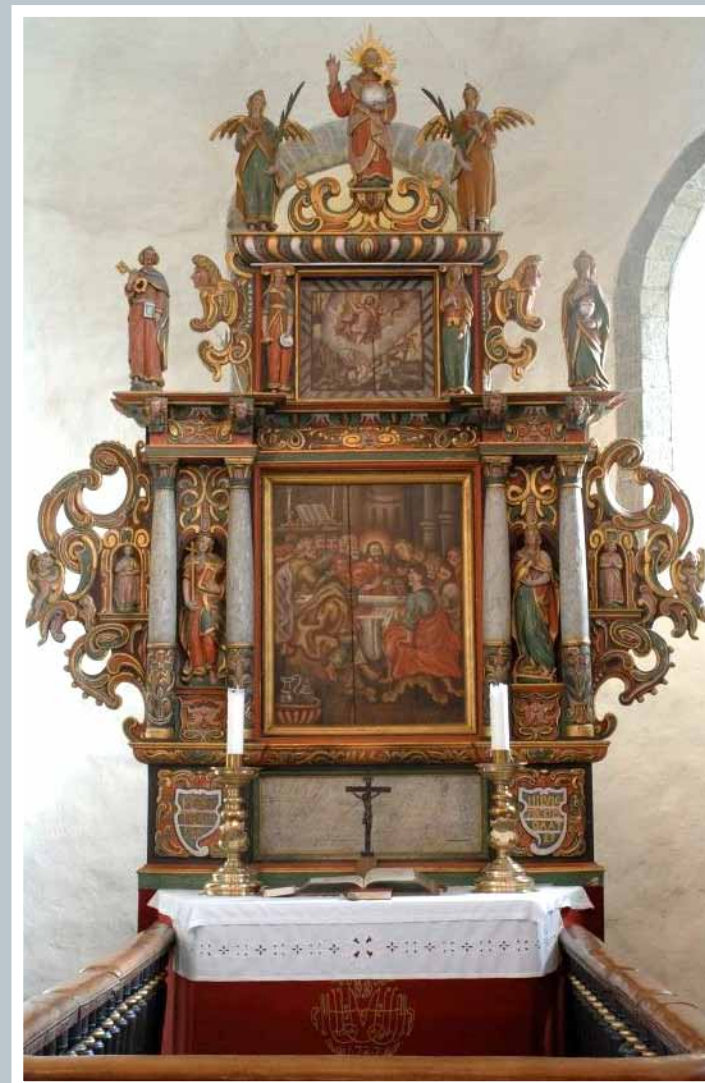
Altertavlen i Hedrum kirke.

Kilder: Hedrum kirke, Kirke og menighet i 900 år, Larvik 1960. Hedrum kirke, 950-årsjubileum, Larvik 2010.