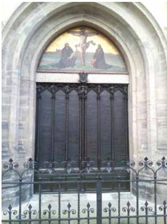
Den berømte kirkedøra i Wittenberg (en nyere utgave) med Martin Luthers 95 teser.