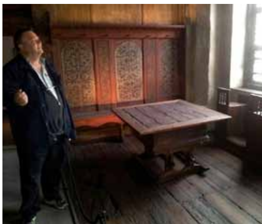
Artikkelforfatteren holder bordtale ved Martin Luthers eget stuebord.

I Wittenberg er det også både et Cranach-haus og et Melancthon-haus, som vi hadde mulighet til å besøke. Lucas Cranach d.e. var både kurfyrstens og Martin Luthers gode venn, og hans malerier bidro både til å illustrere og å fremme reformasjonen. Et av hans malerier; «La de små barn komme til meg» henger i Larvik kirke. Ta en titt på det neste gang du er der.