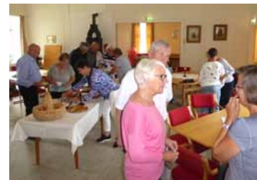
Kaffe og kaker på Volds Minde.