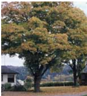
Høsten har en ettertenksomhet i seg, en god melankoli som også kan lede tankene til livets ulike tider.

Mye står på spill i høstukene for folk som lever av jordens avling, nå som tidligere, i Hedrum som i verden forøvrig. Jeg vil tro at bonden kjenner på glede og takk når stråforet er pakket i rundballer og traktoreggene ligger stabla opp eller er kommet i hus, når poteter, gulrøtter og løk er på lager og kornet levert på mølla. Nå kan låvedør og traktorgarasje lukkes for ei stund.