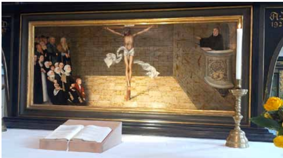
Bildet fra altertavla i Mariakirken i Wittenberg. Et sentralt luthersk motiv.

Å få være på disse sentrale stedene i Martin Luthers liv og virke, var for meg nesten like sterkt som å besøke de bibelhistoriske stedene i Israel, som jeg gjorde flere ganger mens jeg var feltprest i Sør-Libanon. Her handler det om Martin Luthers gjenoppdagelse av evangeliet; nåden alene, troen alene, Skriften alene, Kristus alene. Ganske mange til å være alene. Men til syvende og sist handler alle disse «alener» om det samme som det berømte motivet i et av maleriene på alteret i Mariakirken (Stadtkirche) i Wittenberg; prekestolen, menigheten og en korsfestet Kristus i sentrum (bildet). På mange måter illustrerer dette lille maleriet det sentrale innhold i den lutherske reformasjon, som har preget landet vårt i snart 500 år.