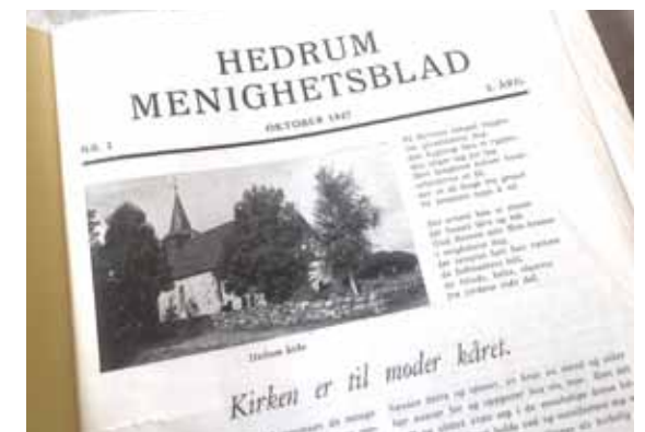
Slik var første utgaven av Hedrum menighetsblad i 1947.