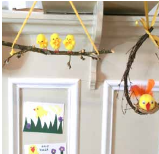
Påskedekorasjoner på verkstedet.