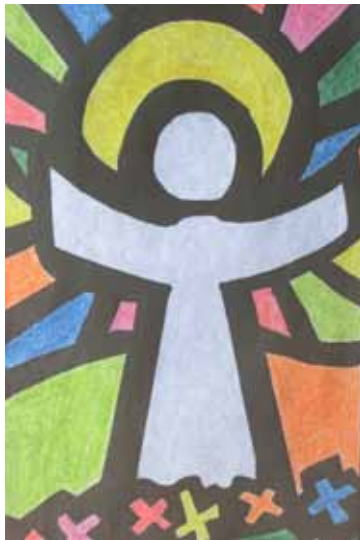
Jesus oppstått som «glassmaleri».