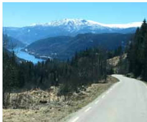
Utsikt fra kontoret – Borgegrend ved Rødberg

Det er ofte hektiske arbeidsdager med lange turer inn og ut av bygder, daler og over fjell. Det som slår en, er at vi har et mangfoldig landbruk drevet av iherdige bønder i en fantastisk natur.