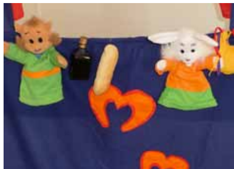
Joffen og Kamille fortalte om nattverd.