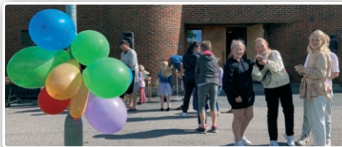
Fest med ballonger og grillpølser.