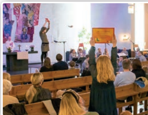
Utdeling av 4-årsboka.

Vi skal dele ut bøker til 4-åringene i oktober, og i november blir det tårnagenthelg med familiegudstjeneste. På en av kirkekaffene blir det også satt opp egne bord der vi skal lage pynt som skal pryde kirkerommet i desember. Vi håper på fine samlinger sammen i høst og ønsker alle varmt velkommen! ■