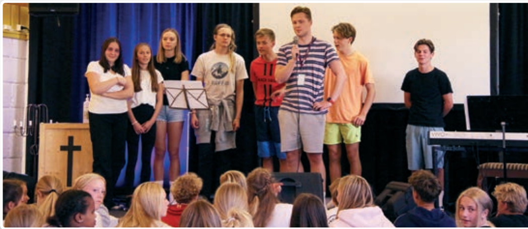
Underholdningskveld på Oksøya.