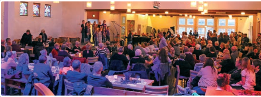
Det blir stas å fylle salene med basar.