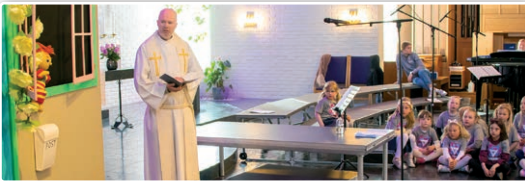
Fra familiegudstjeneste i våres.