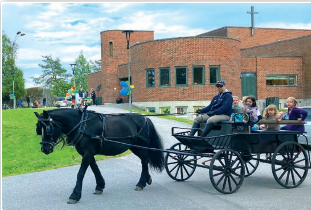
Festens overraskelse var tur med hest og kjerre rundt lekeparksen.