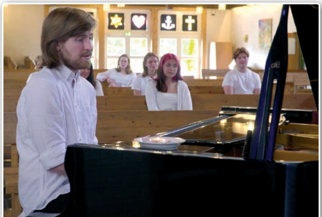
Fra Ten Sing-filmen «High Hopes».