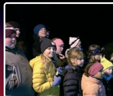
Larvikgjengen på nattsafari.

Etter en natts søvn ble det nye øvelser og til slutt festkonsert. Godt å være i farta! ■