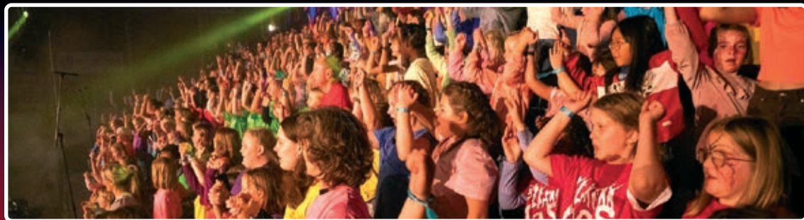
Over 300 barn fra mange kor var samlet til ett stort kor i Kragerøhallen.