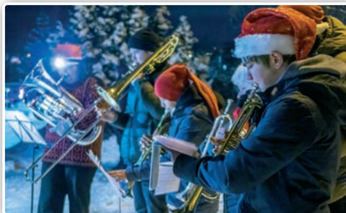
Nanset skolekorps spiller julesanger, mens de som vil kan gå rundt treet.

etterpå - vi håper du kommer onsdag 30. november kl. 16.30. ■