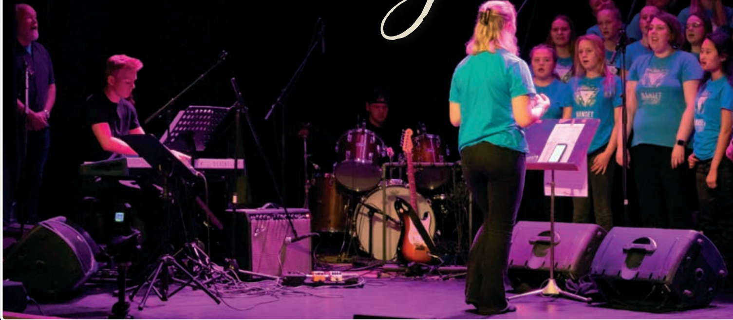
Dans, drama og korsang med band - det er Ten Sing!

På under 3 måneder har i underkant av 30 ungdommer jobbet målrettet for å få på plass årets forestilling. Forestillingen gikk av stabelen mandag 14. november i Festiviteten og hadde tittelen «Troen i meg».