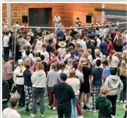
Stavernhallen var full med ungdom.

Vi gratulerer Tanum med seieren og håper på revansje neste år! ■