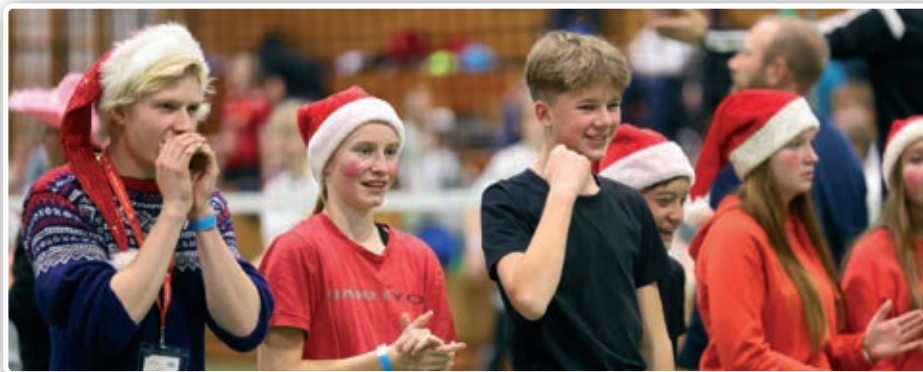
Nansetkonfirmanter som heier på laget sitt.