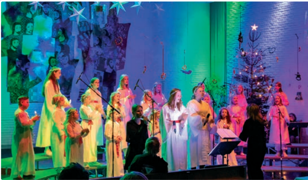
Den tradisjonsrike Luciakonserten er verdt å få med seg!