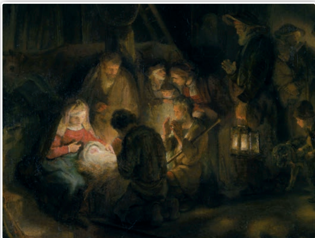
Maleren Rembrandt sitt berømte maleri «Hyrdenes tilbedelse».