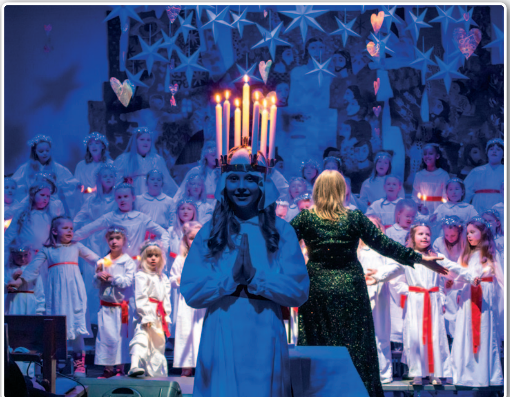
Årets vakreste konsert er NaBaGo-korenes Luciakonsert!