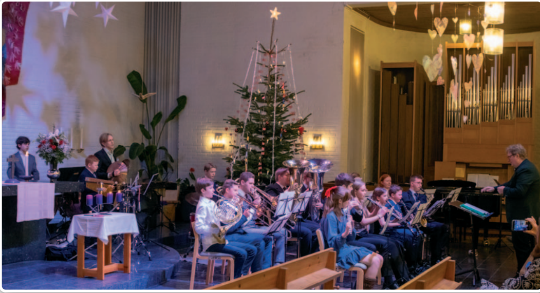
Nanset skolekorps spiller på julaftengudstjenesten kl. 16.00.