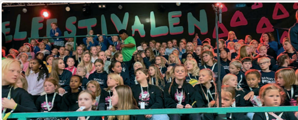
Veldig moro å synge sammen med mange hundre andre barn i et kjempekor!