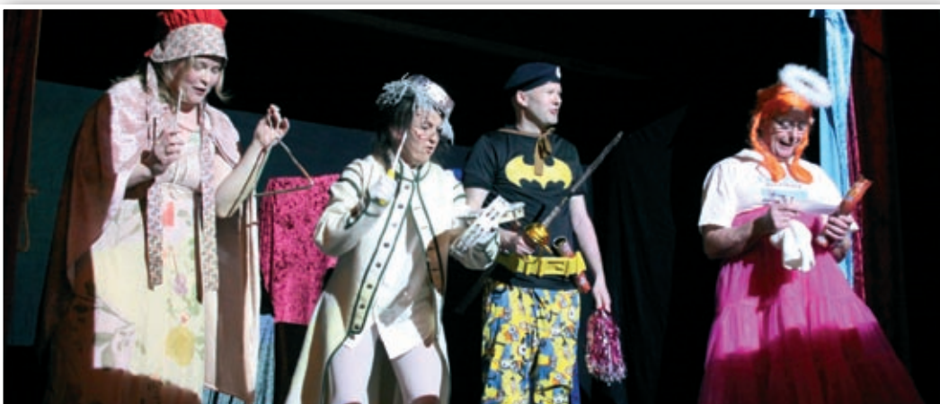
Staben sto for kveldens morsomste innsalg.

og enkle ord snakket han så unge og gamle kjente det både i lattermuskler – og i hjerterøttene. Deilig lasagne og bugnende kakebord hørte også med. Det ble en super kveld – vi gleder oss alt til neste gang! ■