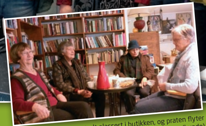
Litt av vareutvalget. Her bør det være noe for enhver smak!