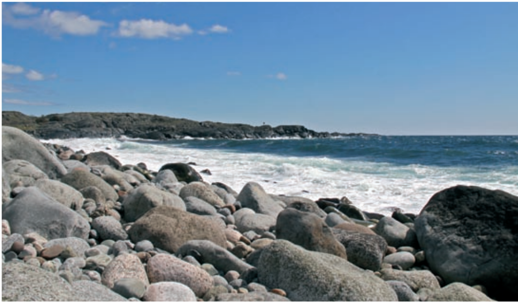
På Mølen vil det være gudstjeneste palmesøndag til minne om Nesjarlaget i 1016.