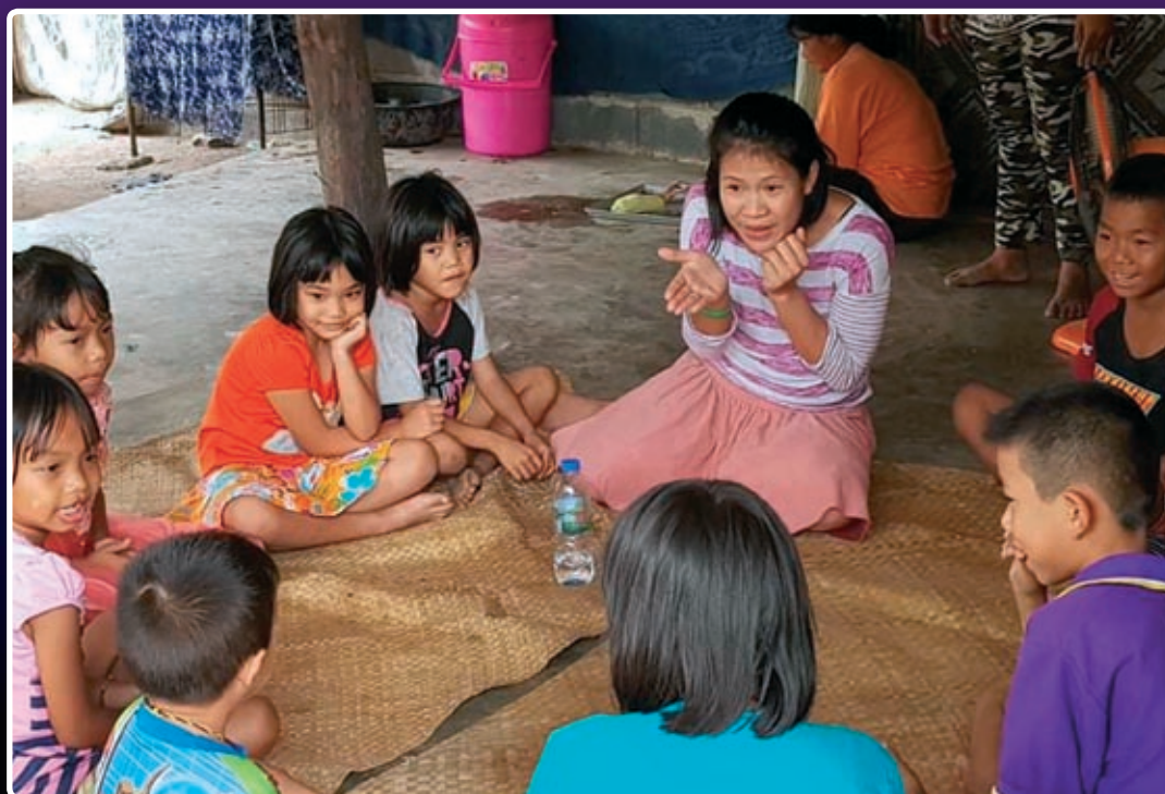
I Namthaeng kirke, Ubon har de startet barnearbeid.