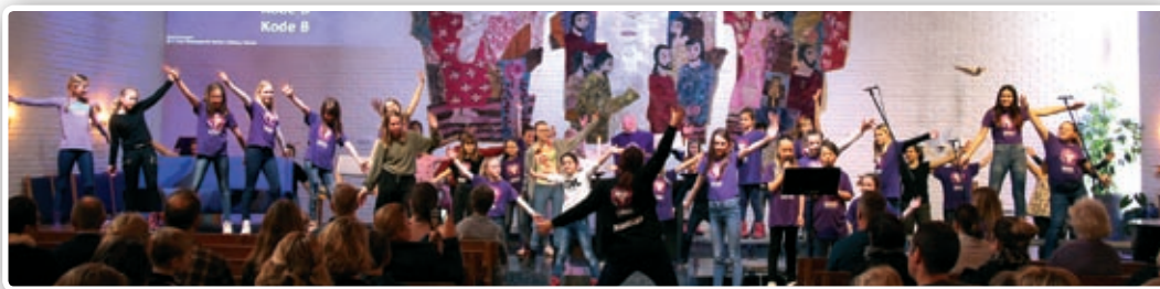
KodeB-gudstjeneste: med bibel, bønn, brorskap og brødsbrytelse – og barn!

På søndag hadde vi en flott KodeB-gudstjeneste. Med bibel, bønn, brorskap og brødsbrytelse kan det bli mye liv og røre, sang, dans og gode møter! ■