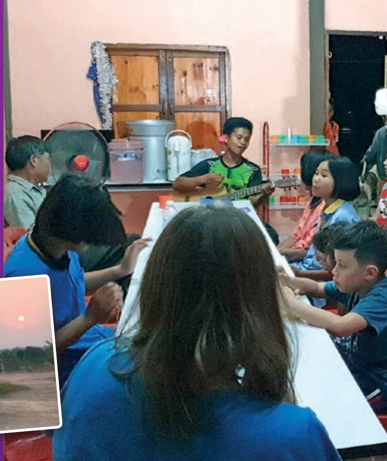
Undervisning og sang for barn og ungdom i Khongchiam, Ubon.

Nanset menighet har støttet Det norske Misjonsselskap (NMS) sitt prosjekt, Barnas kirke i Ubon i Thailand siden januar 2017. Visjonen bak Barnas kirke er å bygge kirke på barnas premisser og utruste barn til selv å lede. Evangeliet formidler et budskap om likeverd og kan løfte opp barn, gjøre barn bevisst på sine rettigheter og bidra til utvikling.