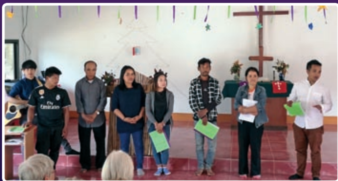
Barne- og ungdomsledere i Banden kirke.