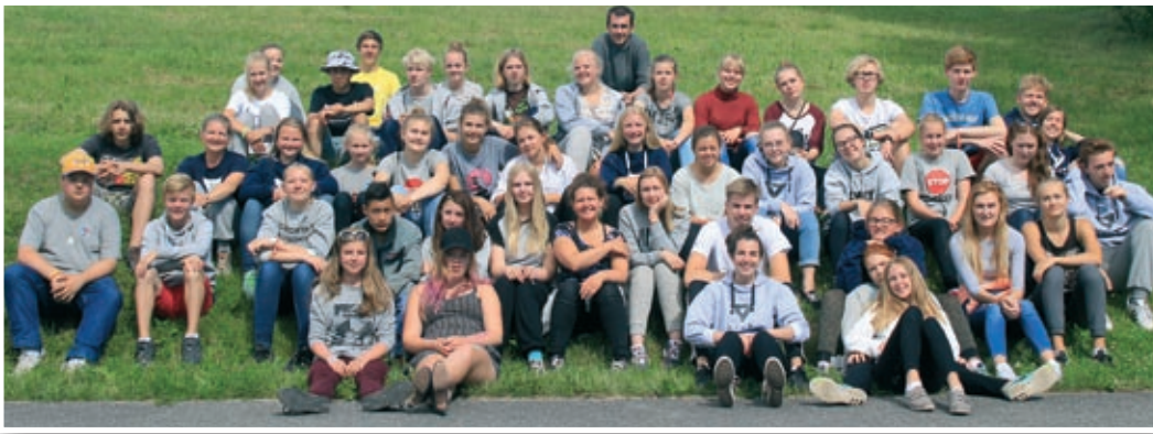
Ungdommer og ledere fra Nanset på KFUK-KFUM-festival.