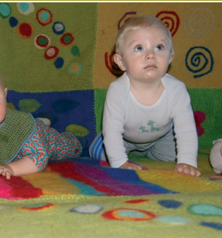
Knøttesang i peisestua på mandager.