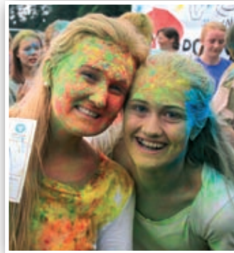
Fargerikt Global-løp.

I tillegg var globalt engasjement på dagsorden - vi løp Global-løp, deltok