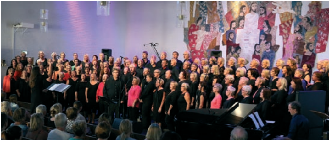
Kicks 110 korsangere feiret 15-årsjubileum med konsert i Nanset kirke.