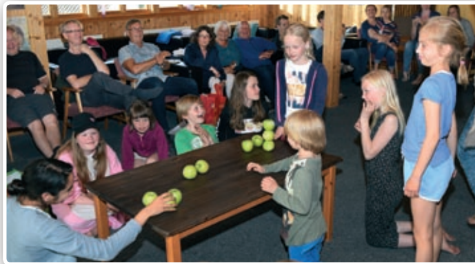
Kveldsunderholdning med store og små.