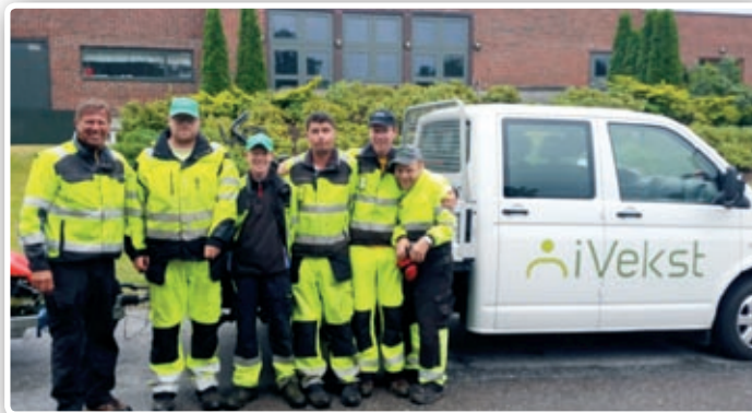
Her er noen av de flinke gutta fra iVekst.

Plenene på uteområdet til Nanset kirke blir klippet og stelt av en arbeidsgjeng fra iVekst. De er engasjert av kirkelig fellestråd. Det er en fryd å se gutta i aktivitet. De stiller mannsterke opp og jobber med iver og stolthet til hele området er strøkent. Det er trivelig å oppleve at det er pent rundt kirka vår. Vi takker for flott innsats! ■