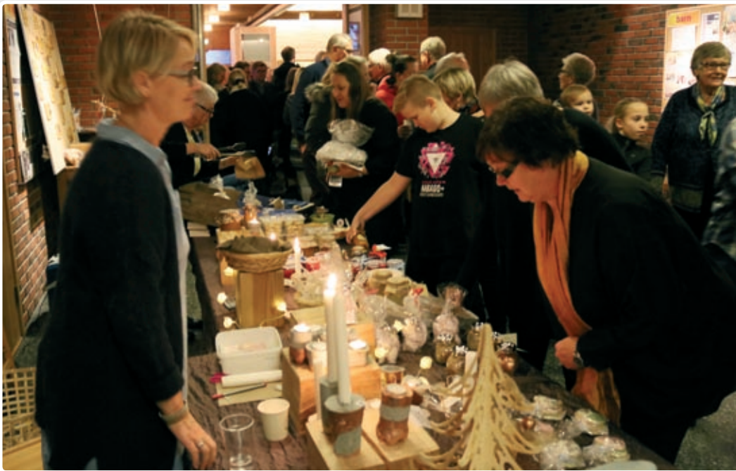
Fjorårets basar trakk mye folk til salgsboder og loddsalg.