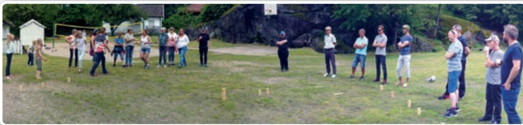
Kubbspill var en populær aktivitet.