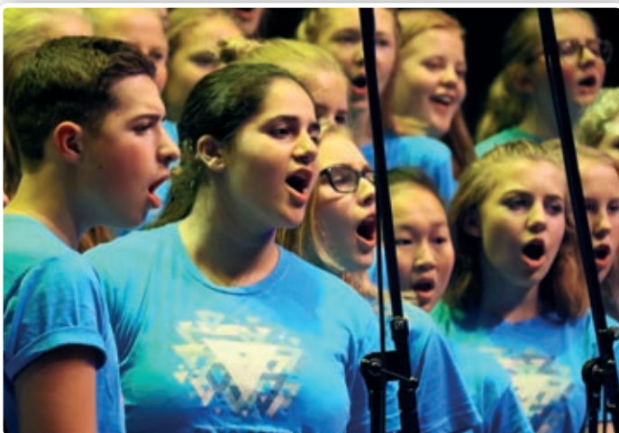
Fra Ten Sings konsert i Bølgen i fjor.

selv, og er derfor en helt unik opplevelse dere må få med dere. Det arrangeres to konserter, kl. 17.30 og kl. 20.00. Billetter selges i billettluken på Bølgen eller via deres nettsider.