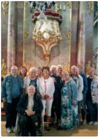
I Kongsberg kirke.