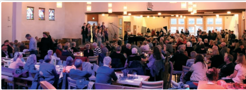
Basaren var godt besøkt, og ga et stort overskudd til barne- og ungdomsarbeidet i kirken.