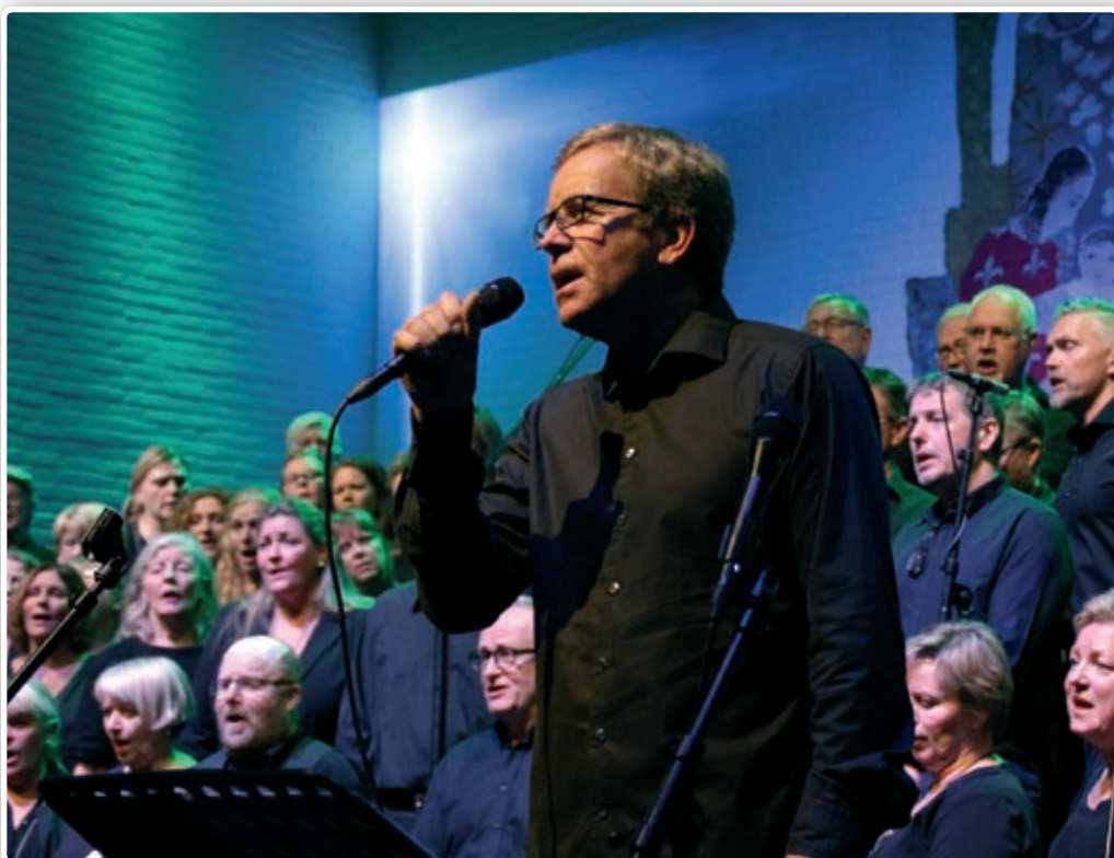
Koret Kick holder to julekonserter torsdag 14. desember i Nanset kirke.