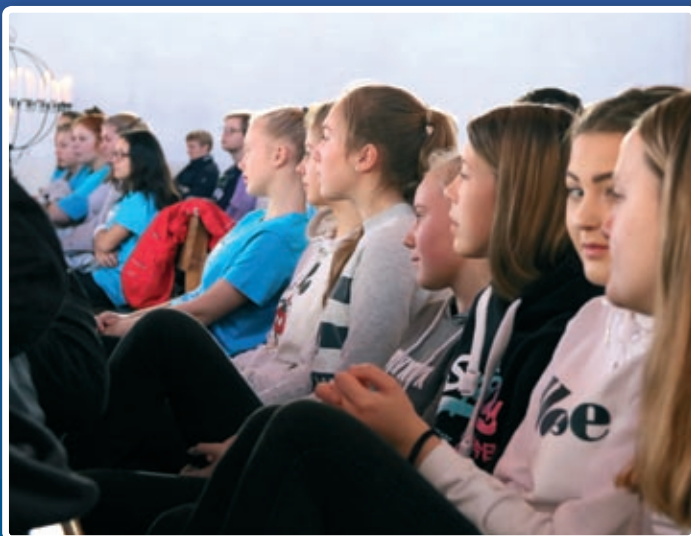
Det ble en innholdsrik uke og langhelg for konfirmantene. Den ble avsluttet med Ung Messe-gudstjeneste som de selv var med på å forberede.