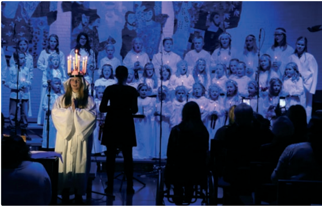
Adventstidens høydepunkt er Lucia-konsert med NaBaGo og NaBaGo Pluss.