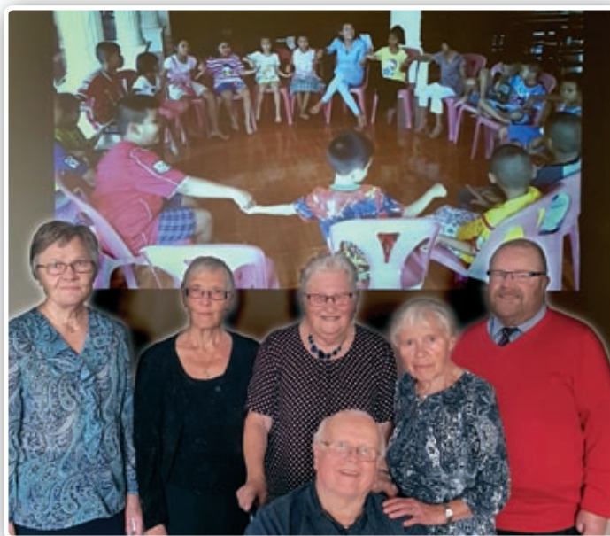
Hovland misjonsforening er 50 år.