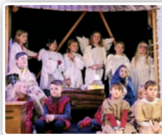
Skolen har gudstjeneste med julespill.

Søndag 7. januar kl. 17.00 Juletreffest for alle!