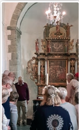
Alteret i Hedrum kirke og utenfor Styrvoll kirke.