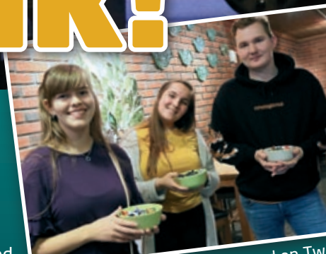
Alle ble ønsket velkommen med en Tw

i Misjonskirken Larvik, i Brunlanes Frikirke og nå var turen kommet til Nanset. Det ble en flott kveld med over 120 ungdommer tilstede. Gudstjenesten fant sted i kirkerommet med lovsangsband, bønnevandring, nattverd, tale og lek og moro. Etterpå myldret det rundt i huset med aktiviteter