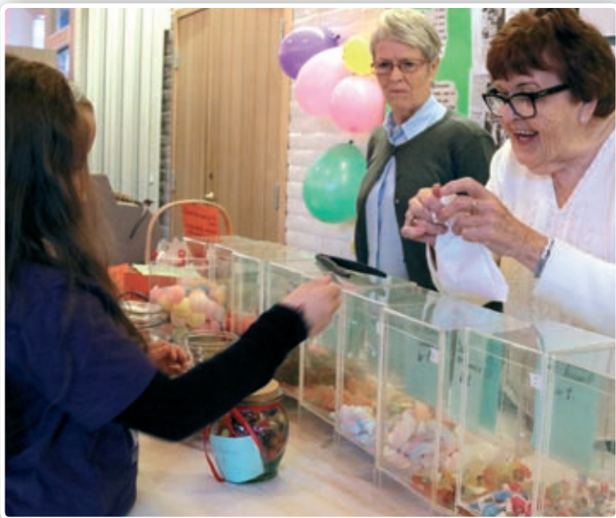
Det var populært å kjøpe smågodt hos Lita.

Basaren, som er den store årlige dugnaden i kirka, involverer mange både fra stab og frivillige. Basarkomiteen og kirkeringene takker alle som har bidratt til at vi også i år har fått et svært godt resultat. Det ble omsatt for vel kr. 80 000 som er et godt bidrag til barne- og ungdomsarbeidet. ■