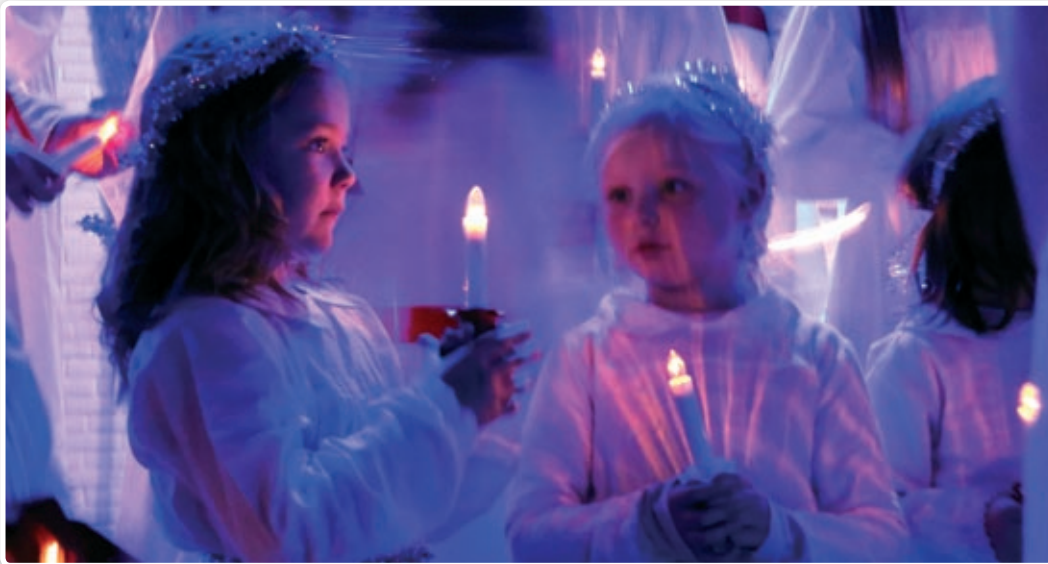
Fra fjorårets Luciakonsert med NaBaGo-korene.