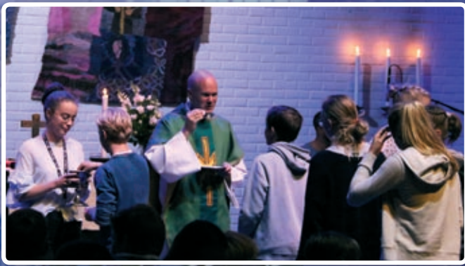
Mange ungdommer deltok på nattverden.