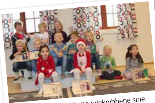
Deltakerne med de flotte julekrybbene sine.

Lørdag 2. desember var det tid for juleverksted for 5 åringer. Her ble det laget mye fint! Barna pyntet blant annet lys-lykter med steiner i ulike farger og snekret sin egen julekrybbe.