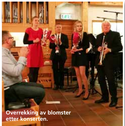
Overrekking av blomster etter konserten.