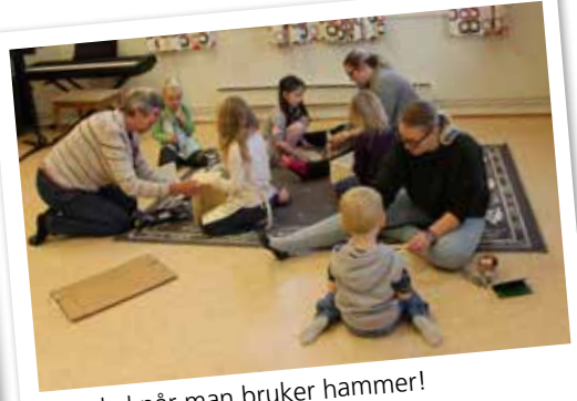
Mye lyd når man bruker hammer!