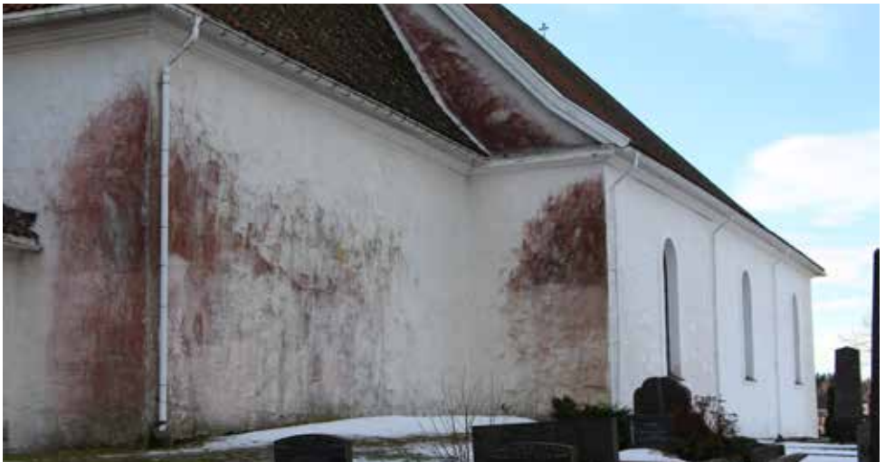
Kirkens østvegg mot RV 303 Tjøllingveien er sterkt preget av sopp og skal nå rehabiliteres. Den lange nordveggen er allerede rehabilitert og er hvit og fin.