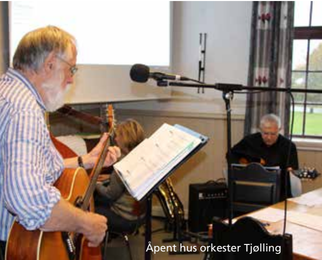
Åpent hus orkester Tjølling