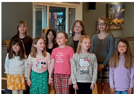
Konsert med BiTs i kantina på sykehjemmet.

Vi øver tirsdager fra kl. 17.30 til 18.45. På øvelsene våre synger vi, hører en andakt og har pause med frukt og lek. Første øvelse etter sommerferien er tirsdag 22. august.