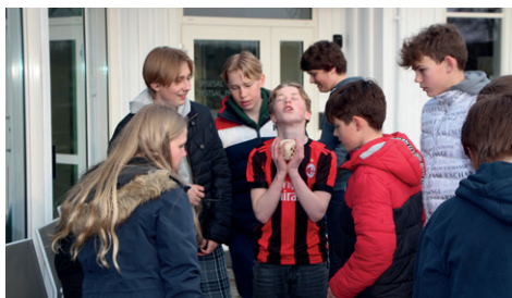
God innsats i 50-leken.