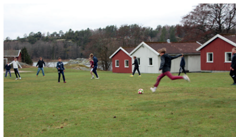
Gode muligheter for utendørs aktiviteter.