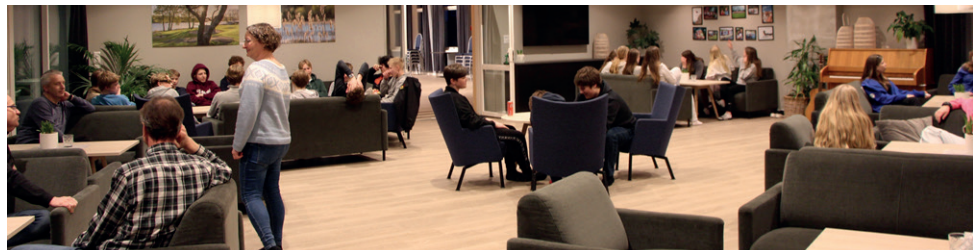
God stemning i peisestua.

Vi har hatt et flott konfirmantår med 34 ungdommer fra Tjølling. I april var vi på leir på Strand leirsted i Sandefjord, og for en flott gjeng å ha med på leir! Her ser dere noe av det vi holdt på med i tillegg til forberedelse av samtalegudstjenesten som var på søndagen.