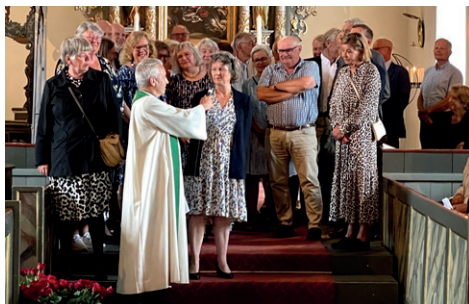
På gudstjenesten kom gullkonfirmanterne fram og mottok hver sin rose.

Søndag 18. juni var det gudstjeneste med påfølgende samling på menighets-senteret for årets gullkonfirmanter – de som ble konfirmert i 1973. Det ble en hyggelig samling med god mat, gode samtaler, latter og mimring.