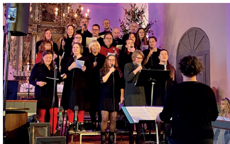
Fjorårets prosjekt-kor i aksjon på Vi synger jula inn.