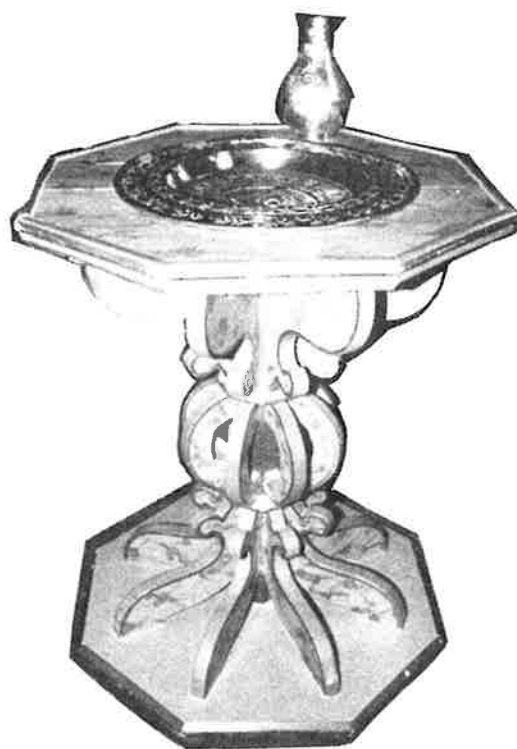
Døpefont fra 1694.

I 1969 mottok menigheten et tilbud om en ny døpefont i marmor som gave. Prøver på marmor og tegninger var vedlagt. Menighetsrådet ønsket å motta gaven i form av alternativ 2 i den tilsendte skisse, og oversendte saken til Riksantikvaren til godkjenning. Riksantikvaren kunne ikke godkjenne at den gamle døpefonten, som han antok var fra 1694, ble tatt ut av kirken. Slik ble det. I ettertid kan vi nok bare erkjenne at Riksantikvaren hadde rett. La tankene våre atter vandre litt. La osstenke på de som har blitt innlemmet i Jesu Kristi rike gjennom dåpen i dette dåpsfatet. Små mennesker med en fremtid foran seg, som levde,