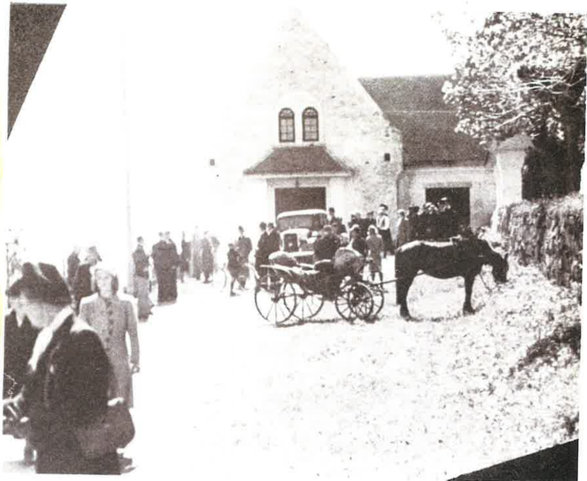
På kirkebakken foran kapellet 1. pinsedag 1945.