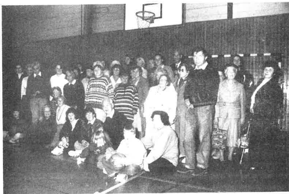
Kirkesight-seeing med innlagt kurvballkamp.

ner prestekontor. Soknepresten fikk ved det en vesentlig lettelse i arbeidsbyrden. Prestegjeldet fikk opprettet kateketstilling i 1971, og 15 år senere kom en etterlenget tredjeprest-stilling, lokalisert til Frogner sogn. Fra 1/2-88 ble også prestegjeldet tildelt en soknediakonstilling, ikke minst takket være et stort økonomisk tilskudd fra stiftelsen Betania på Nøste i Lier. Menigheten måtte nemlig forplikte seg til å utrede 50% av lønnen til denne stillingen, og takket være et stort årlig bidrag fra Betania de første årene, kunne menigheten ta på seg arbeidsgiveransvar for denne stillingen. Fra og med skoleåret 91/92 har menigheten også hatt en såkalt ett-åring i arbeid. Ettåringen er menighetens spesielle ungdomsarbeider. Utgiftene som følger med stillingen, må menigheten selv bære. Fra inneværende år er organist-stillingen i Frogner menighet utvidet til å bli hel stilling. Det knyttes ikke små forventninger til hva dette kan komme til å bety for sang- og musikklivet i menighe-