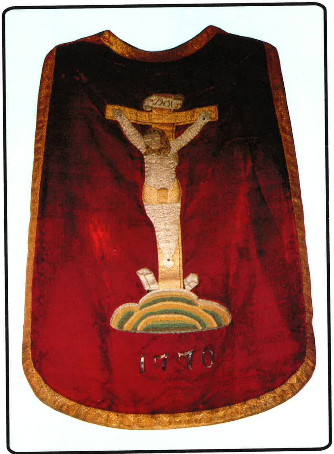
Messehake fra 1770