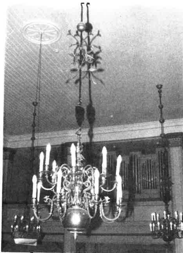
Lysekroner fra 1694.

Et klenodium av de sjeldne er en messehaker i rød fløyel med bredt gullbånd med bølgemønster langs kanten. På forsiden stolpe i