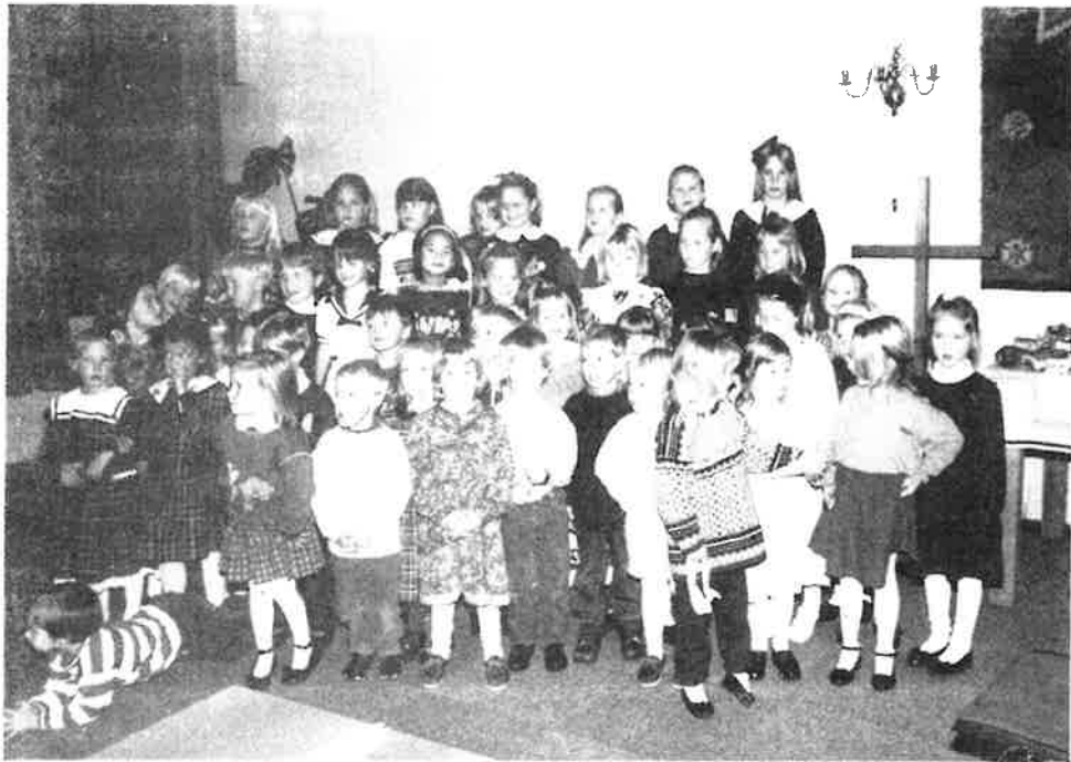
Ungdommelig sangglede i Frogner menighetshus.