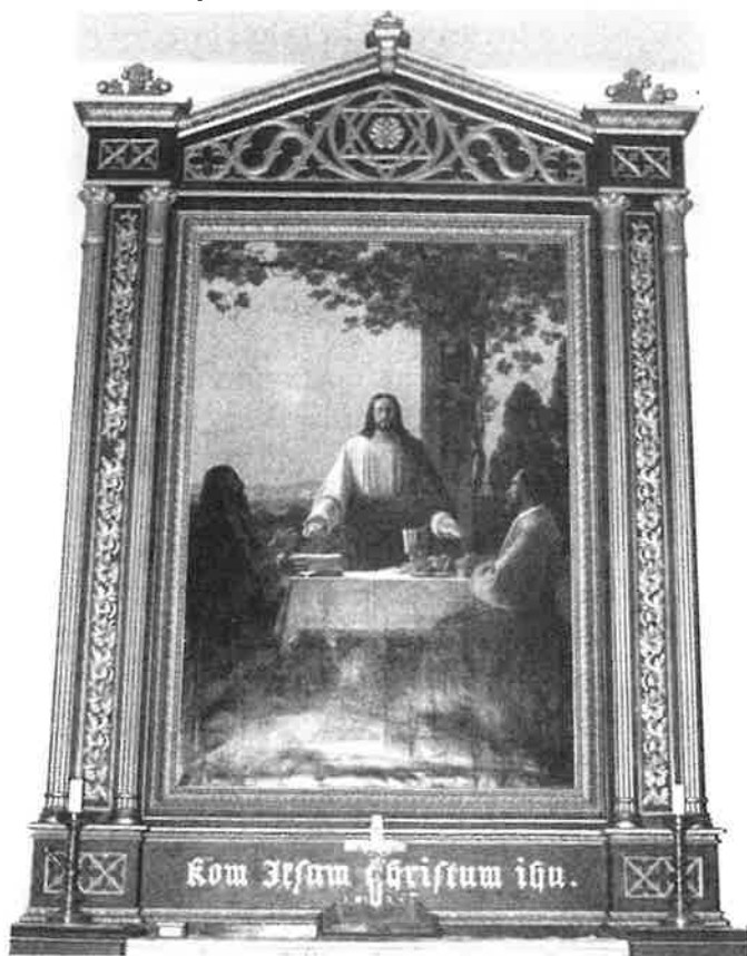
Altartavlen, malt i 1842.

Dessuten deler bordplaten og pilarene bildets høyde og bredde etter det gyldne snitt og vinkalken på bordet er plassert i skjæringspunktet til disse linjene.