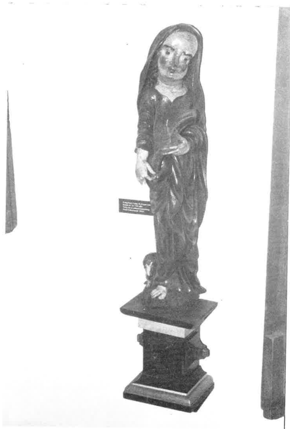
Evangelisten Lukas Bemalt treskulptur fra Frogner kirke 1694