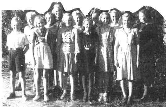
Yngres avdeling, Lier indremisjon, 3. september 1945.