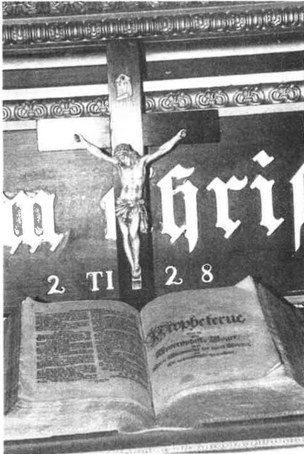
Den svaningske bibel fra 1722 på alteret.