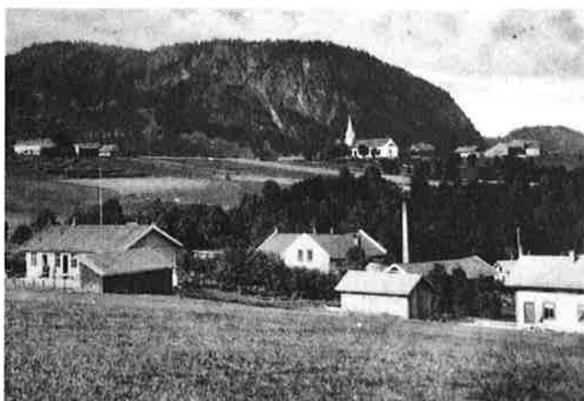
Kirken på høyden, postkort fra 1952.

I hundre år har du været en tilflukt, en åpen favn, og derfor du høyt være æret og signet i Frelserens navn!