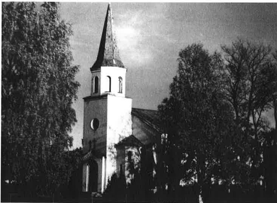
Nåværende tårnfot med spir kom i 1877. Bildet er tatt av Arne Riddervold ca 1953-54.

"Igaar besluttedes i Lier Herredstyrelse: Til ny Tårnbygning med Spir ved Sylling Kirke samt Nedrivelse af den gamle Kuppel