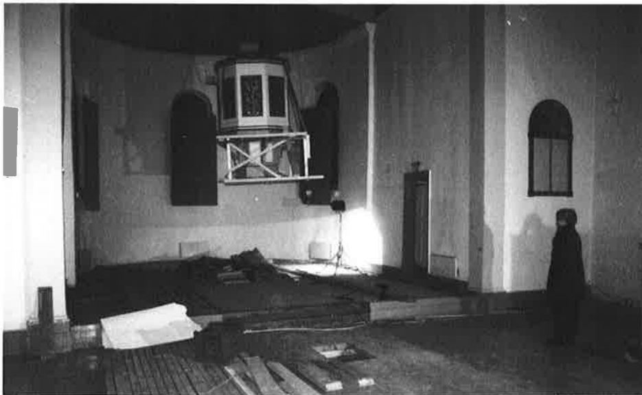
Prekestolen er nå tilbake på plass.