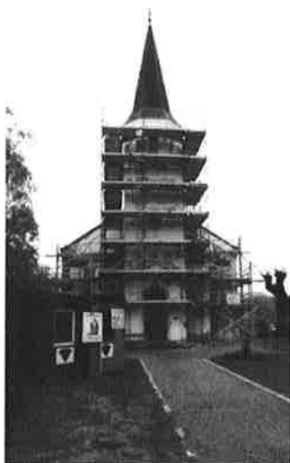
Kirken får en grundig oppussing.

Dåpssakristiet får nye skap og oppvaskbenk med varmt og kaldt vann. Begge sakristiene males som kirkerommet. Over inngangsdørene til begge sakristiene blir det nye vinduer.