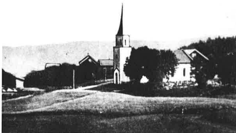
Gammelt fotografi av kirken.

Flere av de gamle norske kongene har vokst opp ved Tyrifjorden. Fra tidlig av begynte man å trekke store båter fra fjorden og ut i havet. Det har de nok gjort, både Halvdan Svarte, Harald Hårfagre og Olav Haraldsson. De har vært på gjennomreise over fjorden eller langs den gamle Kongeveien forbi Sylling kirke.