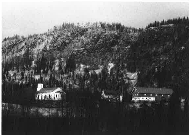
Syilling kirke Kirken ligger godt beskyttet av Hørtekollen.