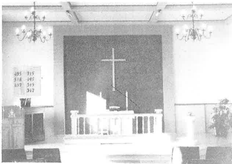
Kapellets storsal etter restaureringen.

Et slikt hus trenges stadig vedlikehold. I 1986/87 gjennomgikk kapellet en grundig restaurering.