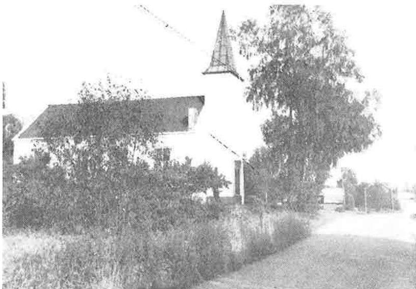
Bedehuset sett fra sør fra Lierskogen sentrum.

Møtet ble ledet av pastor Eriksen, som åpnet med andakt. (Joh 6,37)