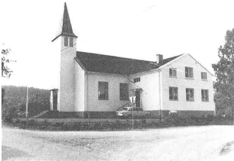
Bedehuset sett fra nord med tilbygg for lillesal og vaktmesterleilighet.

Videre står det i testamentet at legatet skal bestyres av Lier herredstyre som også har at besørge bedehusets opførelse samt at føre tilsyn med det og dets benyttelse.