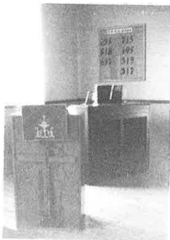
Ny talestol og nummertavle.

I det hele viste det seg at kretsens folk slutter opp om kapellet hva enten det gjelder dugnad eller gaver.