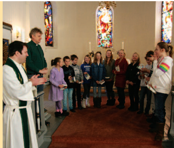
Fra gudstjeneste i Syilling

Det nye ved denne ordningen er at menighetsrådene selv skal utarbeide en lokal grunnordning for gudstjenestelivet i soknet sammen med prest, kirkemusikere, andre ansatte og frivillige i menigheten. Det kan opprettes gudstjenestevalg hvor mennesker i ulike alder, livssituasjon og funksjonsevne kan delta som medliturger.