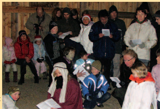
Bilde fra Julevandring i Frogner.

- Folk skal ikke engste seg. Julen er ikke tiden for de store eksperimenter. De vil