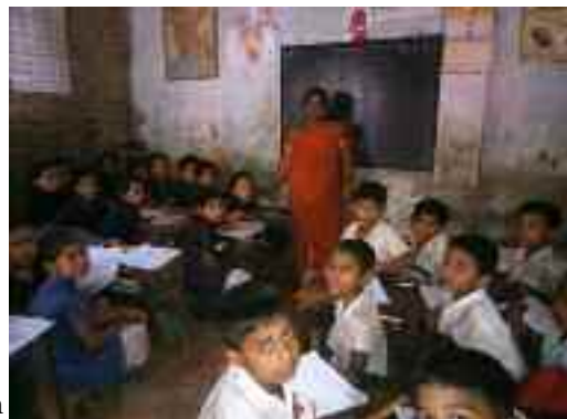
De har tavle & kritt, og sitter 5-6 sammen på hver benk

På bildet over ser man 5 lærere på Patenga Free School sammen med 1 lærer på betaltskolen der (hun med rød, hvit og sort sari ca i midten). På ettermiddags-skiftet er det bare gratisskole i Patenga, men på morgen-skiftet brukes 1 av klasserommene til betaltskole. KFUK har nylig startet med betaltskole i Patenga for de som kan betale litt for å gå på skole, men som ikke kan gå helt til den kommunale skolen, som også har over 100 elever i hver klasse. Noen av elevene følger nysgjerrig mer - de er som oss!