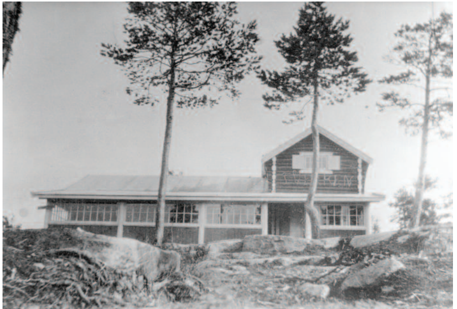
Den første Tverken