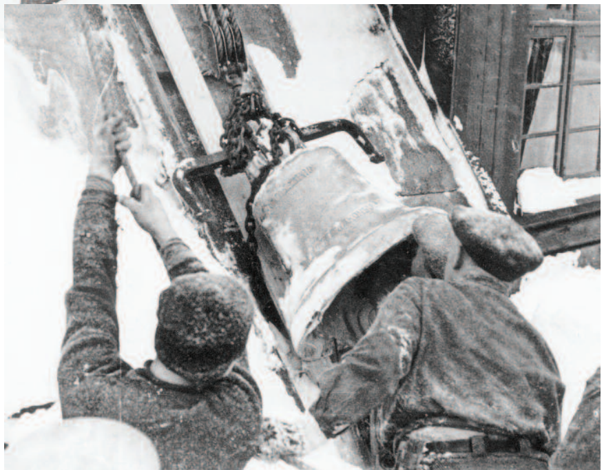
Kirkeklokkene skal opp

Omtale av innvielsesgudstjenesten kommer i et senere nummer. Her vil vi avslutte med et av telegrammene til innvielsen: