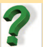
Organist (Tranby og Lierskogen)