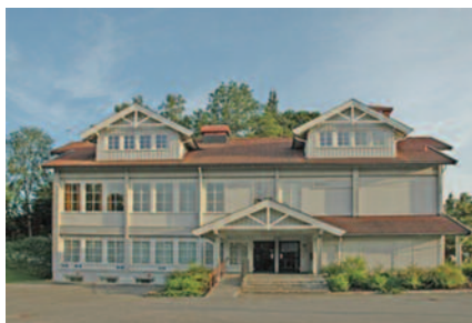
(Tranbys prest og ansatte har kontor på Tranby menighetshus ved Tranby kirke)

Sylling og Sjøstad har kontor på Frogner menighetshus , mens Lier kirkelege fellesråd med sitt ansvarsområde - kirkebygg og kirkegårder, administrasjon av gravferd, arbeidsgiveransvar mm, har kontor i 2.etg. i Fosskvartalet.