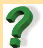
Diakon (Frogner, Tranby og Lierskogen)