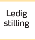
Organist (Sylling og Sjøstad)