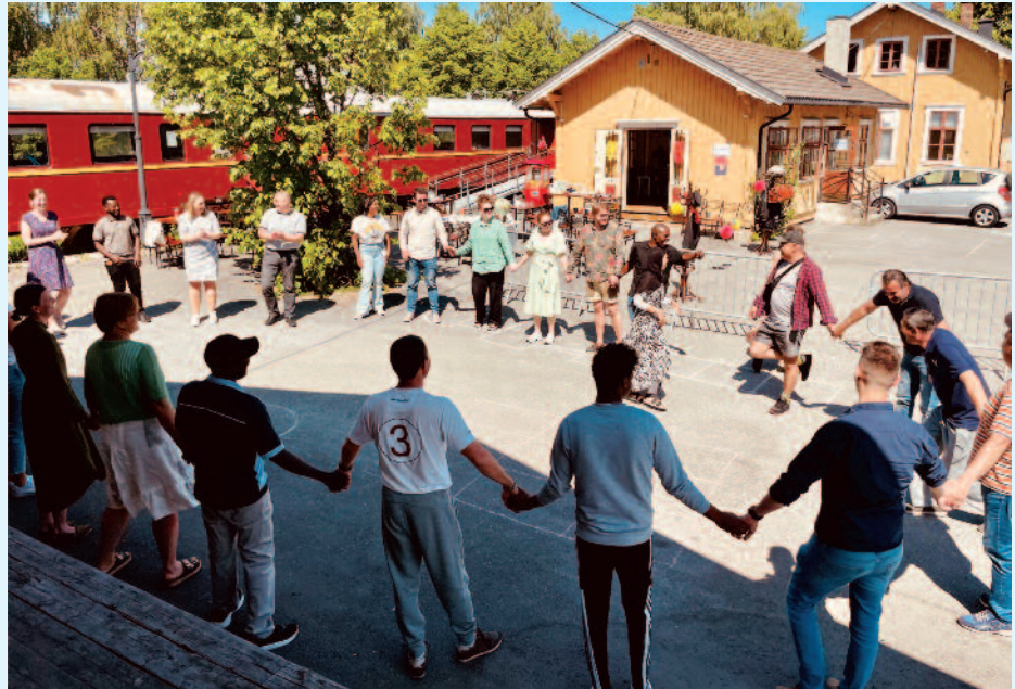
Bildet er fra sommeravslutningen til Mannsgruppa og flyktningtjenesten utenfor Stasjonen

Måltidsfelleskap: hver tirsdag og torsdag kl.15-16:30 (følger skoleåret). Hovedsakelig for flyktninger, men også noen nordmenn knyttet til miljøet. Gratis middag hovedsakelig for de som skal hente matkasse den dagen.