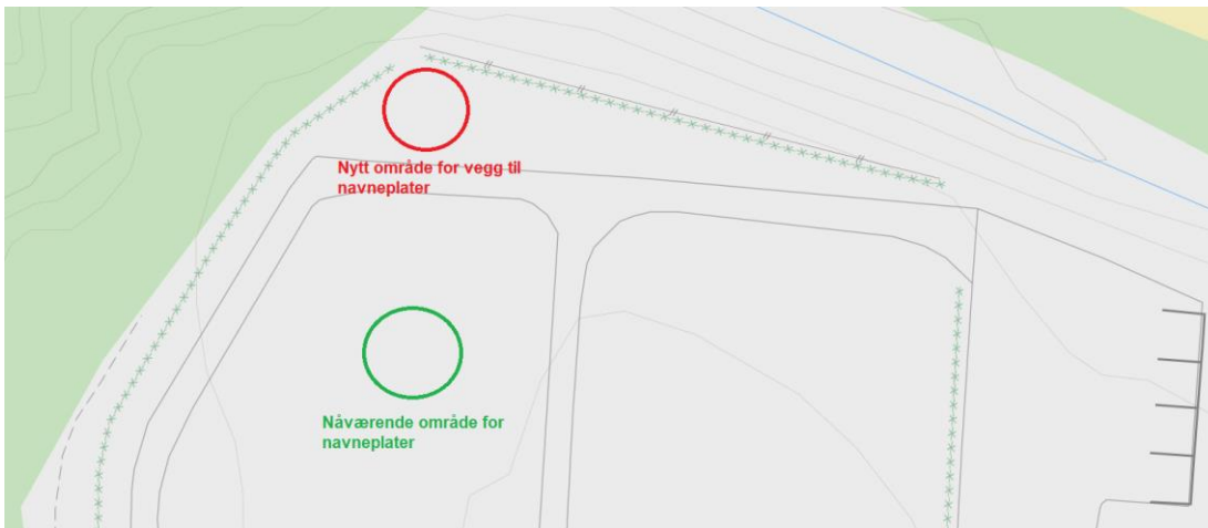
Figur 2: Nåværende og nytt område for plass til navneplater