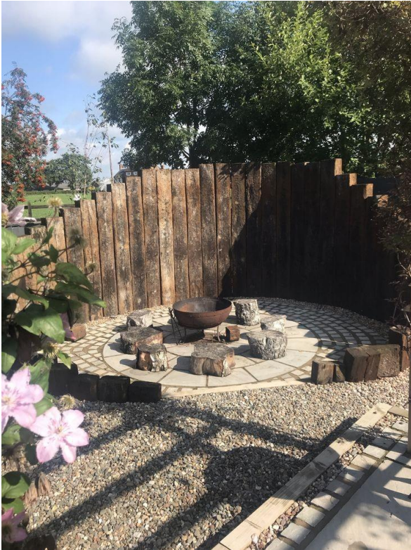
Figur 4, eksempel en svillevegg