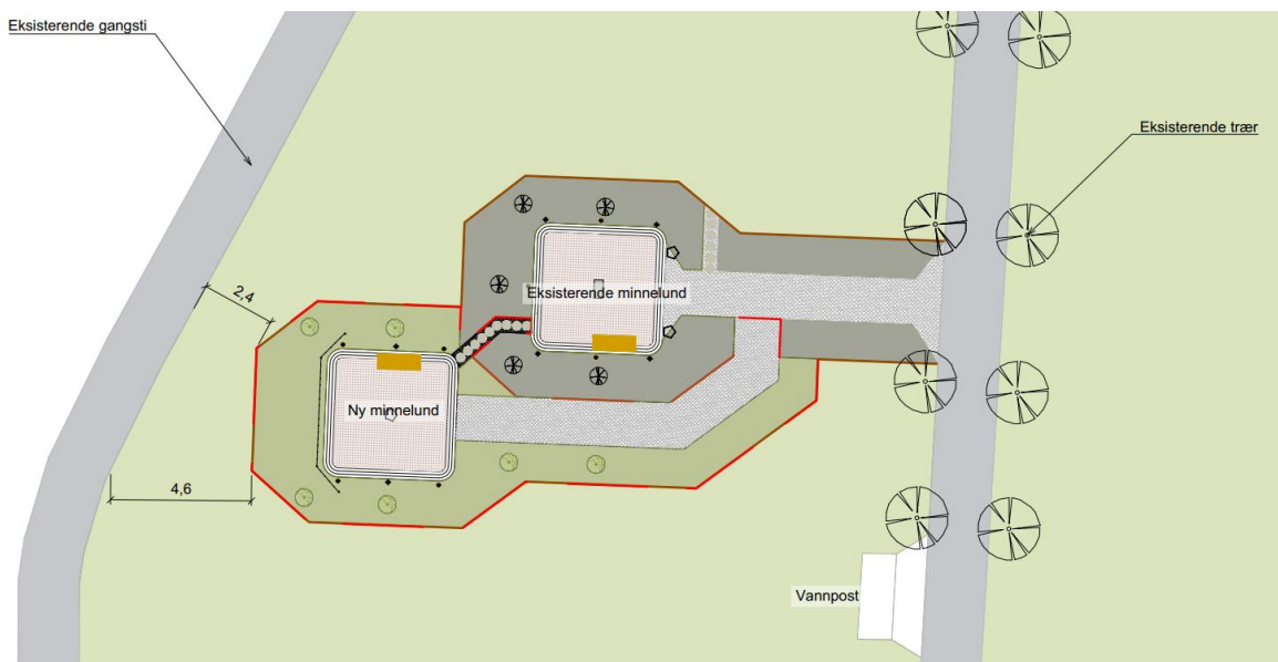
Figur 1, forslag vedtatt i sak 9/22.

Etter dette har våre gravplassmedarbeidere tegnet et nytt forslag som er behandlet og godkjent av Sørums menighetsråd. Ny plassering får sin egen plass i god avstand til dagens bauta med navneplater. Dette gir en større frihet til å utforme det nye området.