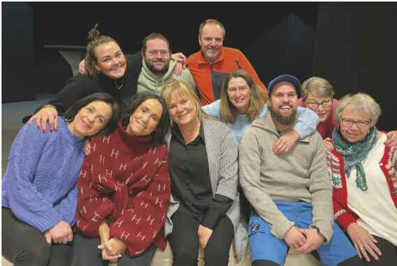
Dalen ungdomslags teatergruppe er en aktiv gjeng som gjerne vil ha flere med

Dalen ungdomslags teatergruppe sin oppsetning i 2024 har fått navnet «Med Fetsi'a opp». Forestillingen/revyen har premiere på Dalheim samfunnshus i Gansdalen den 2. mars.