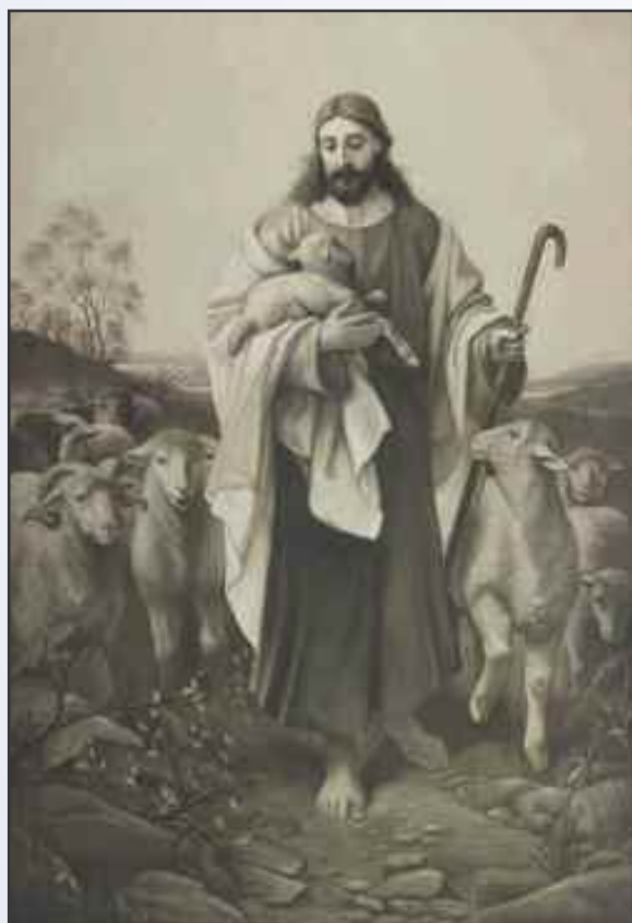
“Den gode hyrde” av Christian Olsen

Når det snakkes om nåde kan det handle om hvem Gud er, det kan handle om hva Gud har gjort, Kristushendelsen som Guds frelseshandling for verden. Og det kan handle om hva nåden gjør med oss, og vårt fellesskap. Ofte vil disse aspektene klinge sammen i vår opplevelse av nåden.