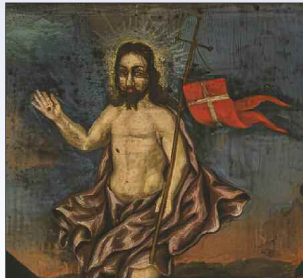
Fra altertavelen i Fet kirke. Jesus sin seierrike oppstandelse.

Nåden er også dynamisk og kraftfull. «Og vår Herres nåde har vært overstrømmende rik og har gitt meg tro og kjærlighet i Kristus Jesus. Det er et troverdig ord og vel verdt å ta imot, at Kristus Jesus kom til verden for å frelse syndere, og blant dem er jeg den største. Men når jeg fikk barmhjertighet, var det for at Kristus Jesus skulle vise hele sin tålmodighet på meg som den første, til et forbilde for dem som senere skulle komme til tro på ham og få evig liv.» (Paulus’ første brev til Timoteus 1.14-16). Apostelen Paulus erkjenner ydmykt sin fortid som forfølger av kirken, samtidig som han eksemplifiserer hva nåden kan gjøre med et menneske. Nåde handler både om tilgivelse og dyp endring. Nåden har transformerende kraft.