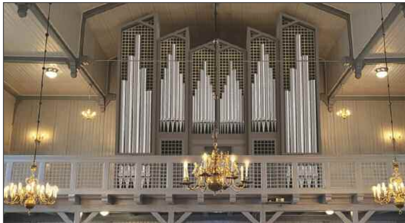
Slik skal det nye orgelet se ut når det er ferdig montert i kirken