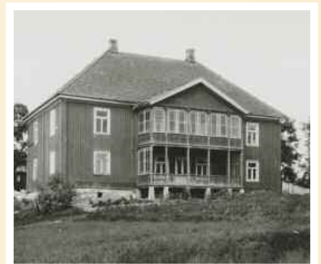
Bildene er hentet fra Lokalhistoriewiki.no. Over til venstre: Fet prestegård i andre halvdel av 1800-tallet. Foto: Ole Tobias Olsen. Over til høyre: Gan gård, Akershus. Foto: Anders Bugge. Under: Fetsund bru under ombygging 1876. Foto ukjent. Nederst til venstre: Gahnsdalens Handelsforening. Foto ukjent. Nederst til høyre: Tømmerfløtere i arbeid ved Fetsund Lenser. Jernbanebrua over Glomma i bakgrunnen. Bildet er hentet fra Nasjonalbibliotekets bildesamling Fetsund.