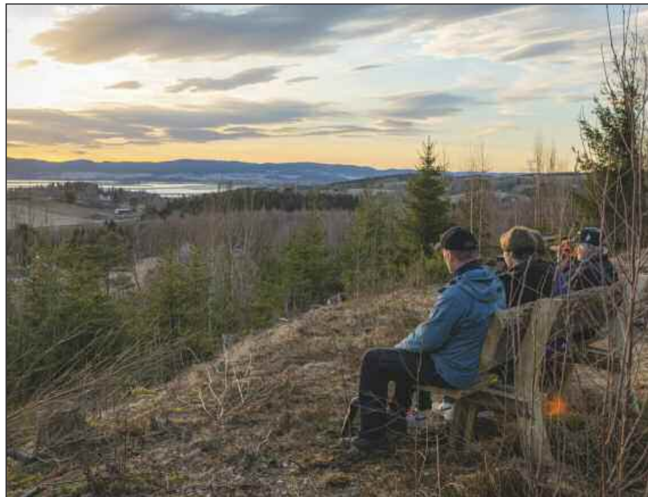
Storslått utsikt fra Bjørnhaugen.