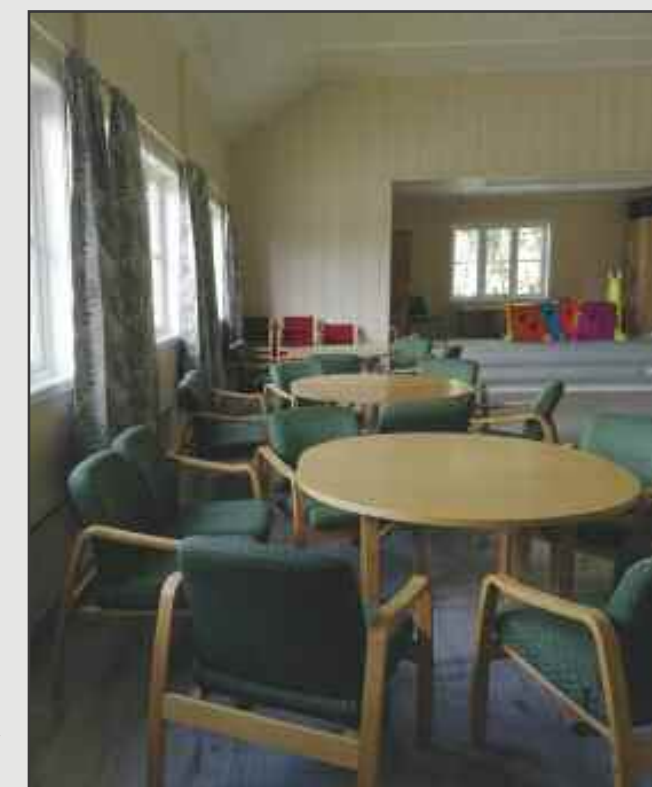
Nye gardiner og møbler på plass.