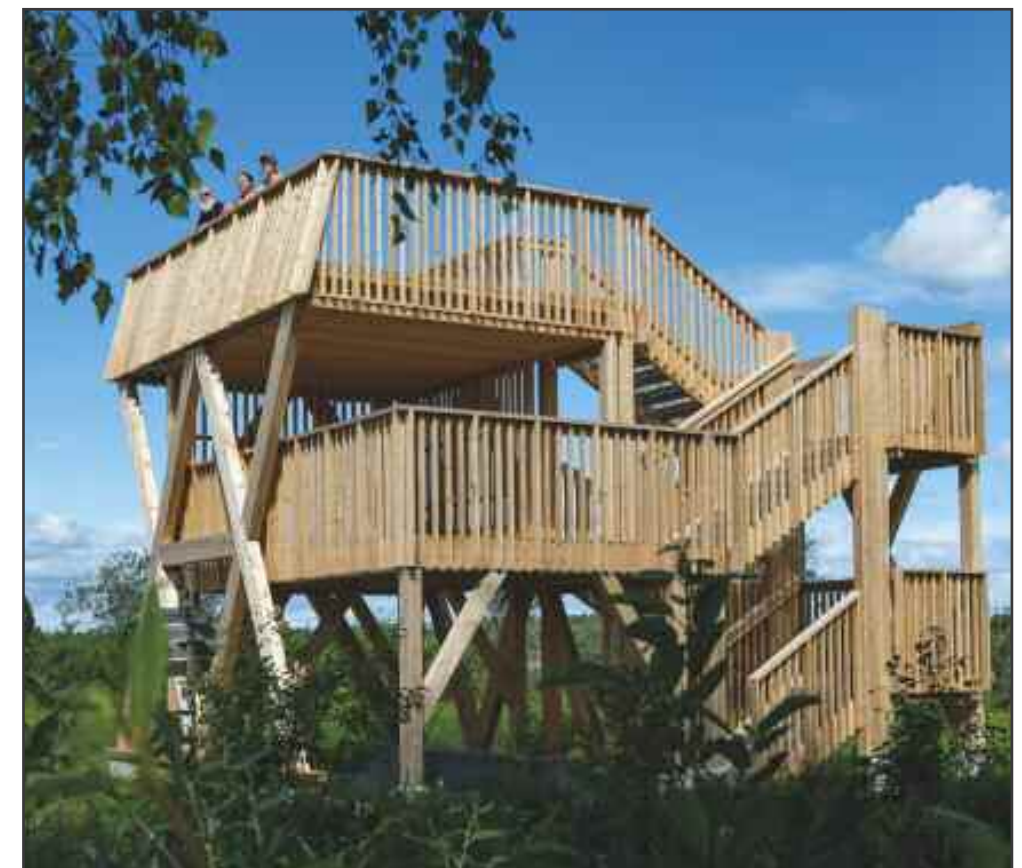
Fugletårnet skal bl.a. benyttes av 4000 skoleelever årlig

Etter åpningen var det fritt fram for de frammøtte til å