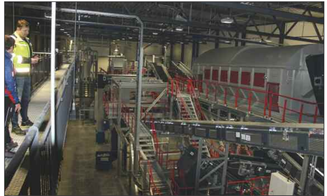
Torben Beck viser fram noe av utstyret fra produksjonslinjen inni fabrikk

Fabrikkssjef i Veolia, Torben Beck, forteller at de hadde målsetting om å være i full drift fra 1. januar 2021, men koronasituasjonen har gitt dem noen utfordringer. Nå er de i en innkjøringsfase, og vil i løpet av første kvartal ha hele produksjonslinjen i full drift. Da vil en stor del av alle plastflaskene som er behandlet av Infinitum være omdannet til et høyverdig råstoff til produksjon av nye plastflasker.