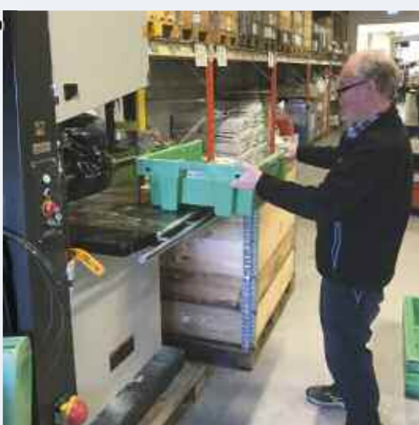
Plasten må videre skjæres opp i mindre biter.