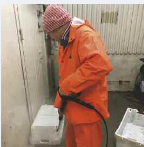
Deretter må plasten rengjøres med kost og høytrykkspyler.