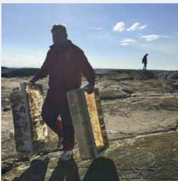
Frivillige som samler inn plast i strandsonen, det blir store mengder.