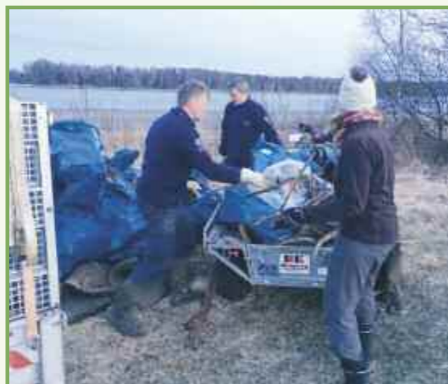
Strandrydding ved hjelp med Statens Naturoppsyn

Vi har vært opptatt av å bevare det som er igjen av ravinlandskapet i Fet, og har vært en pådriver for bevaring, kartlegging og klassifisering av ravinene våre. Lillestrøm kommune har nylig vedtatt en verneplan for raviner i Skedsmodellen av kommunen, og vernet skal på sikt utvides til hele kommunen, noe vi i Fet er glade for.