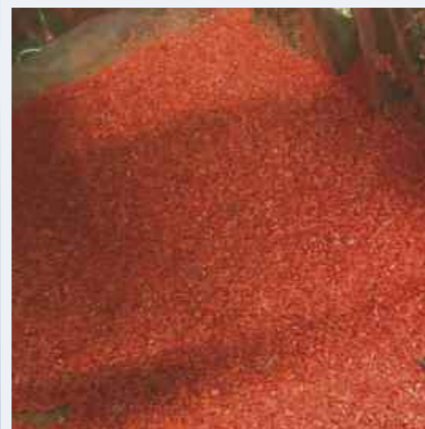
Her ser dere de mindre plastbitene gjort om til plastgranulat.