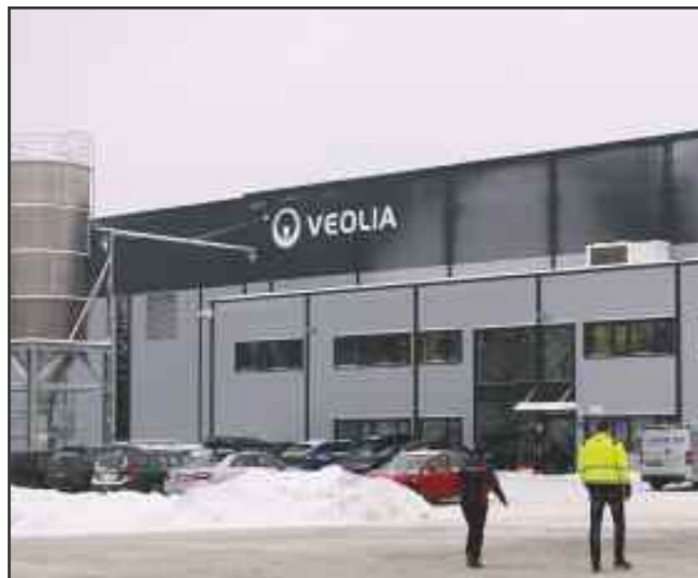
Utenfor Veoliafabrikken på Heia i Fetsund

Pantesystemet Infinitum, som eies av dagligvarehandelen og drikkevareprodusentene, har bygget et mottak for plastflasker og et resirkuleringsanlegg for flaskene på Heia industriområde i Fetsund.