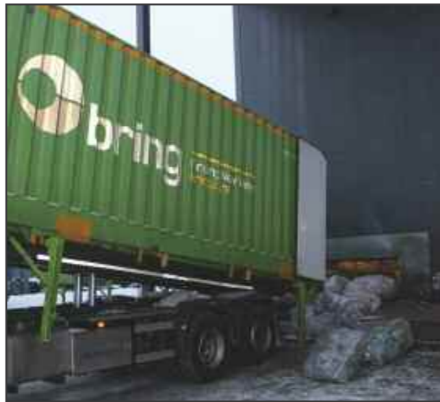
Lossing av plastflasker fra lastebil

- Vi skal være modige, nytenkende og miljøengasjerte, og vi skal gi våre plastflasker evig liv, sier Ståle.