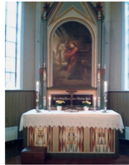
Alterpartiet i Blaker kirke.

Onsdag 15. mars Blaker kirke kl.19: Fastesamling / Salmekveld ved Gro Golimo Simonsen og Jan Erik Stensrud