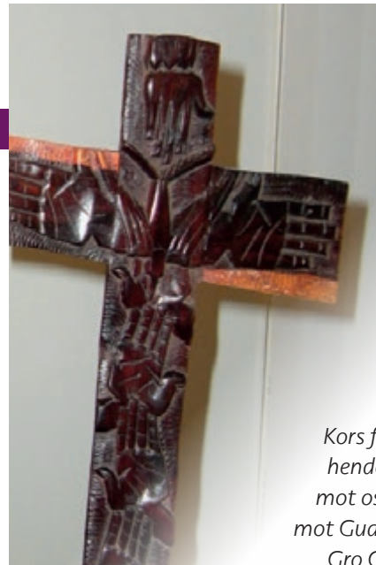
Kors fra Tanzania med hender – Guds hender mot oss og våre hender mot Gud og verden.

Frammøtesteder: alle tre kirker samt Sørumsand misjonshus kl. 17.00 for de som vil være med.