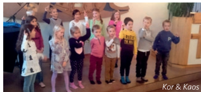
Kor & Kaos