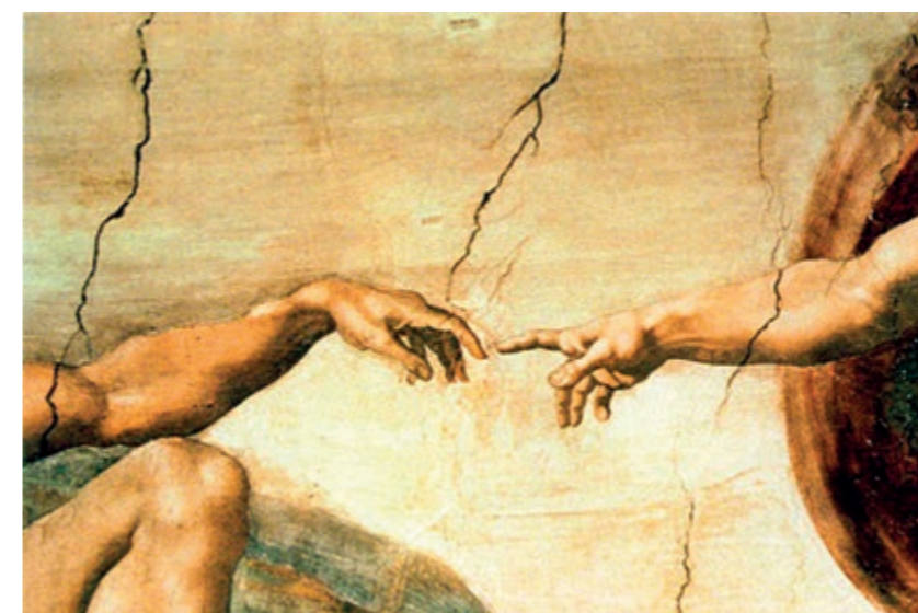
Utdrag fra bildet «Skapelsen» av Michelangelo.

Og det gir meg et ansvar for å elske min neste og være mot han eller henne, slik jeg vil at andre skal være mot meg. Og når vi ikke får det til, så er Gud der og vil forme oss på nytt. Vi blir ikke kastet vekk som noe ubrukelig. Til det er vi for verdifulle. Gud har tro på oss! Vi er skapt i hans bilde til å bli elsket og til å elske.