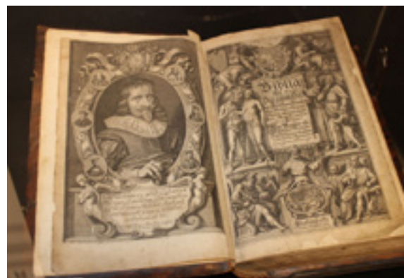
En av Christian IVs bibler

En vandring gjennom gjennom dette museet er både interessant og spennende. Gå inn på nobimu.no for å sjekke program og åpningstider.