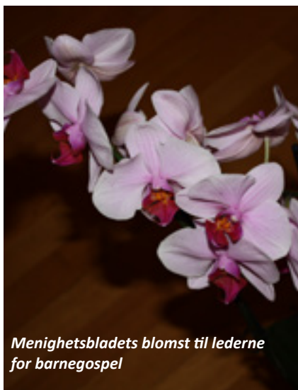
Menighetsbladets blomst til lederne for barnegospel

Kunne du tenke deg å dirigere en fin barnegospelgruppe? Eller kompe koret på piano eller gitar? Eller være den trygge voksne som er tilstede og tilgjengelig på øvelsen? Lederne i Sørumsand barnegospel gir seg nå etter mange år. Vi takker dem, og håper at noen vil overta stafettspinnen!