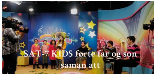
SAT-7 Kids, Foto: Åslaug Ihle Thingnæs, NMS

Hva vi svarte. Her er svaret lederen for stasjonen gav: «Hei. Vi er en kristen radiokanal, og derfor sender vi kristen musikk og andre kristne innslag. Jeg forstår ikke at dette kan være så provoserende. Tyrkia er et demokratisk land, og også kristne har rett til å produsere og sende radioprogram. Det er naturlig for alle mennesker å dele troen sin med andre. Hvis du ser deg omkring, vil du oppdage at folk fra alle slags religioner gjør dette. Også muslimene i landet vårt forkynner sin tro gjennom religiøse sendinger, men dette har aldri vært noe problem for oss kristne. Vi har aldri protestert mot slike program. Gud elsker alle, uavhengig av rase og religiøs tilhørighet. Når han har en slik kjærlighet til alle mennesker, må også vi elske dem – uansett hvem de er og hvilken bakgrunn eller religion de har. Vi søker å dele med andre det vi selv har mottatt fra Gud. Noen av våre muslimske venner bor i USA, og de søker naturligvis anledninger til å dele sin tro med dem de møter. I og med at USA er en kristen nasjon, så oppleves dette kanskje ikke alltid så enkelt, men de gir ikke opp av den grunn. Kristne i Tyrkia er i samme situasjon. Majoriteten her er muslimer, og det er krevende for oss å dele vår tro med våre landsmenn. Vi forsøker likevel å dele Kristi kjærlighet med dem vi kommer i kontakt med. Kristne er mennesker av kjøtt og blod akkurat som deg, men det ser ut som om du har vanskelig for å akseptere dette. Du står natur-