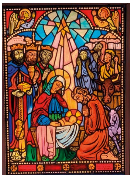
Alterbilde i Mangen kapell, Aurskog-Holand.