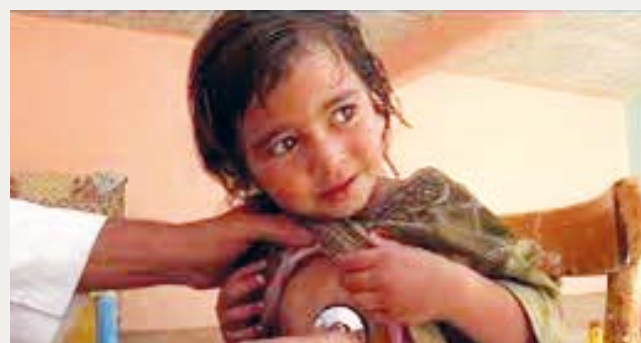
Blaker menighet støtter også Stefanusalliansen, og har Stefanusbarna som sitt misjonsprosjekt