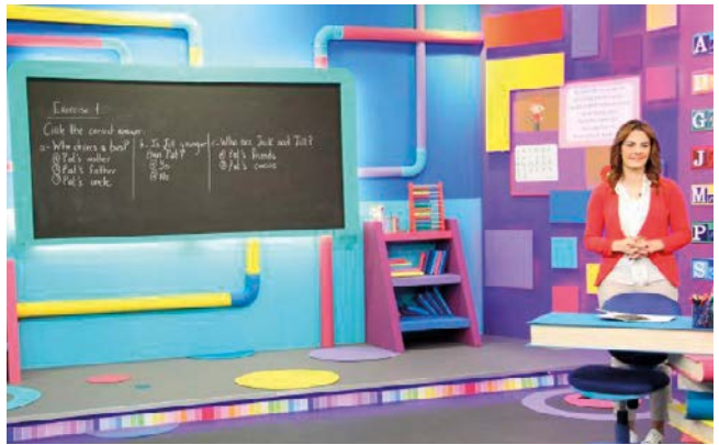
Fra Skole-TV, Foto: NSM

ligvis fritt til å anklage oss overfor hvem du måtte ønske, men én ting skal du vite: Vi bryr oss om deg, og vi respekterer din tro. Jeg vil med dette ønske deg en riktig fin kveld» (sitat slutt).