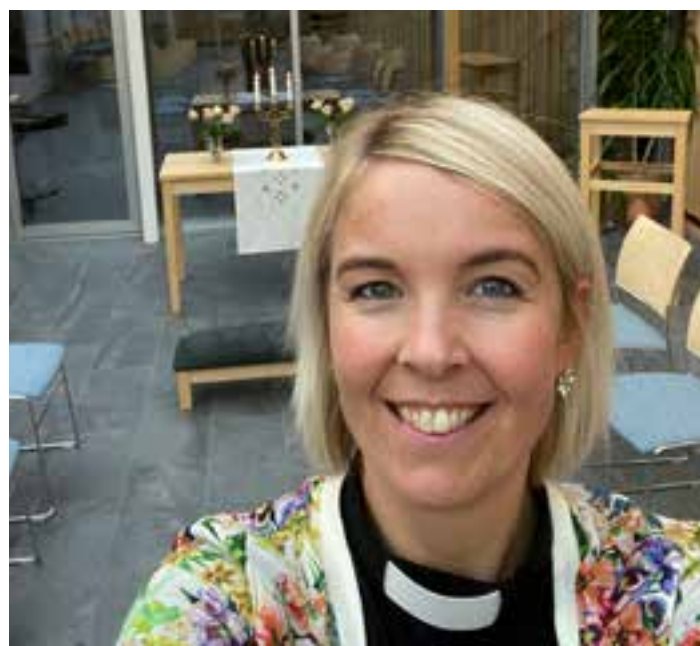
Soknepresten er klar for vielse i Klosterhaven på Kirkesenteret i gågata.

Da korona-pandemien kom til Norge ble vi veldig usikre på hva som var mulig å få til av feiring. Først hadde vi et håp om at pandemien kom til å roe seg raskt igjen på grunn av alle restriksjonene som ble gjort. Men vi innså vel relativt raskt at korona-restriksjonene kom til å bli langvarige og at vi derfor måtte utsette den store bryllupsfesten. Vi hadde på det tidspunkt allerede sendt ut invitasjoner og lagt mye planer for opplegget. Vi bestemte