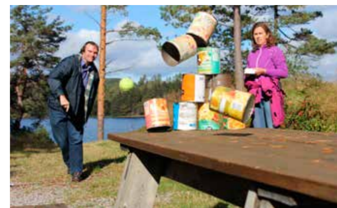
Full innsats når det er actionløype og verdifulle poeng står på spill.