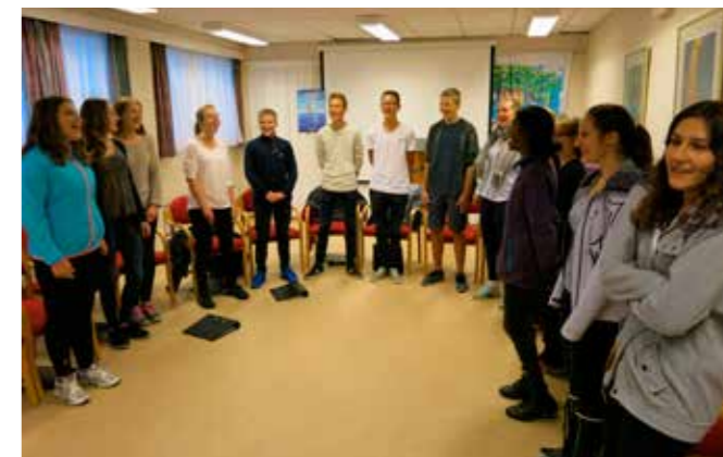
Ungdomskoret øver på menighetshuset i Øvrebyen

- Ikke alt har vært like enkelt, selv om jeg har svært mye å være takknemlig for! Som ung tenåring opplevde jeg at min storesøster ble drept i en trafikkulykke, og det satte dype spor både i mitt liv og hos mine foreldre. Siden fikk vi utfordringer med sykdom i vår egen familie da barna var små. Dette er hendelser som nok har gjort meg mer ydmyk enn tidligere. Livet er ikke bare svart - hvitt, og en kristen tro er ikke noen garanti for et liv bare i medgang. Livet har så mange ulike nyanser og utfordringer, men for meg er det viktig og riktig å ta Gud med i det som skjer, - både det gode og det vanskelige!