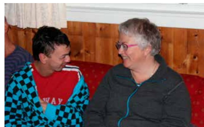
Det blir tid til mange gode samtaler i sofakroken når man er sammen en helg.

Det begynner å bli en god tradisjon. Mot slutten av september reiser Holum menighet på tur, den lange veien helt opp til Skogtun. Alltid like trivelig. En fin blanding av ungdom, og oss godt voksne +.. I år kolliderte turen med høstferien, og det var nok kanskje grunnen til at vi var ca halvparten så mange som vi pleier, og at barnefamilie glimret med sitt fravær. En menighetstur uten barn er ikke helt som det skal være. Når det er sagt, så hadde vi det som vanlig kjempetrivelig, vi som prioriterte å få med oss denne weekenden. Ikke minst er det flott å ha med en god gjeng med ungdommer, som står i spissen for mye: lovsang, møteledelse, actionløype med mer.