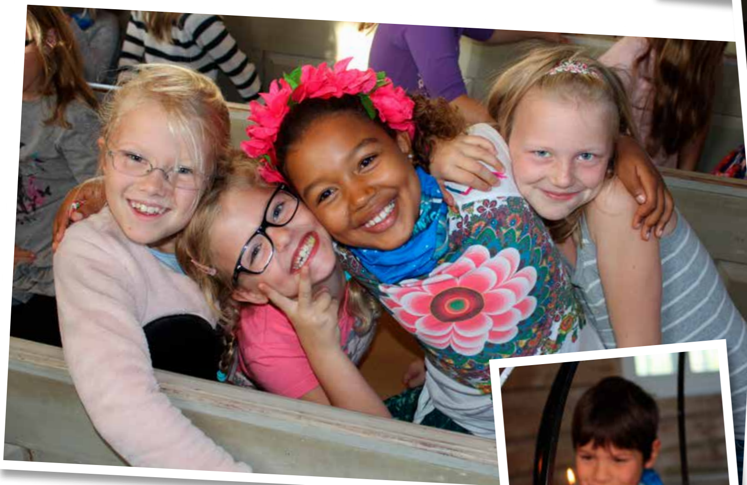
Glade barn på tårnagenthelg

«Det betyr at han gir seg selv for meg, da!»