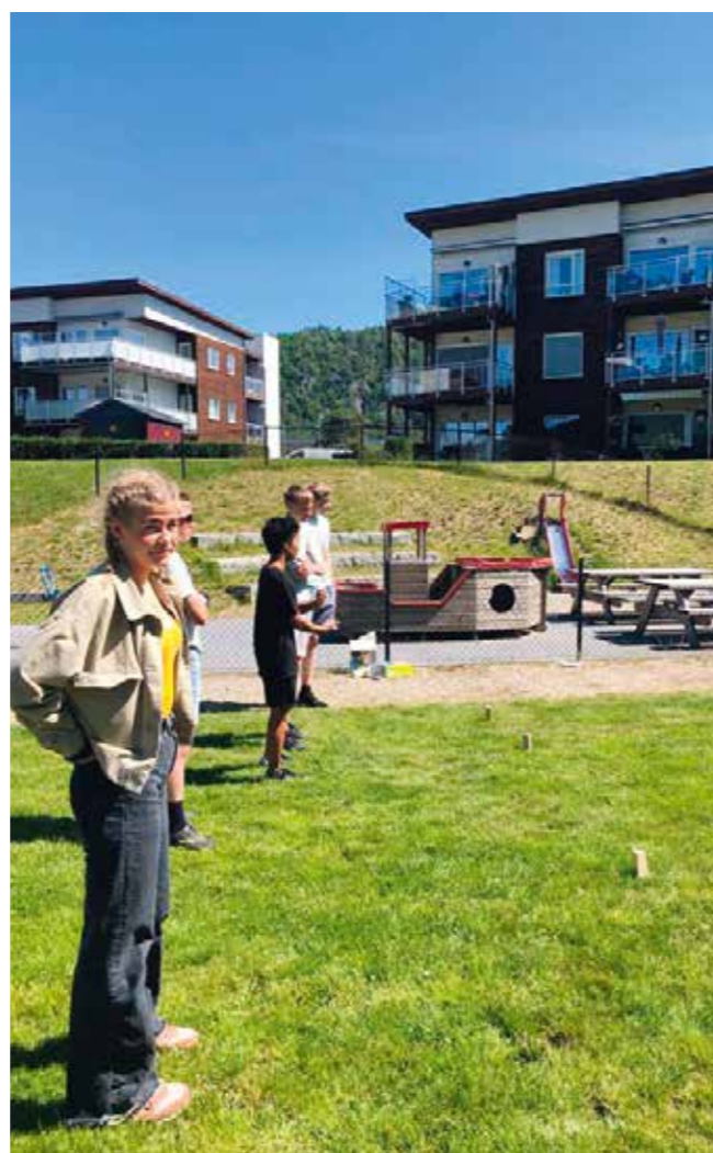
Kubb er goy!