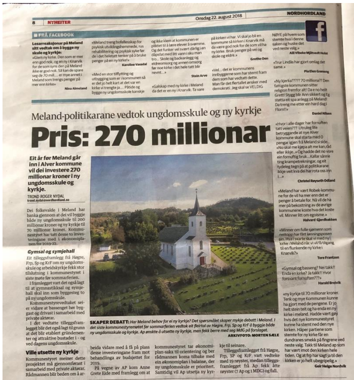
Bilde - 2 Frå ein av fleire artiklar i Strilen som også viser utdrag frå debatten som føregjekk på Facebook