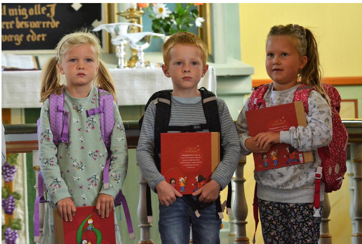
Bilde - 6 Frå gudstenesta med ranselbøn