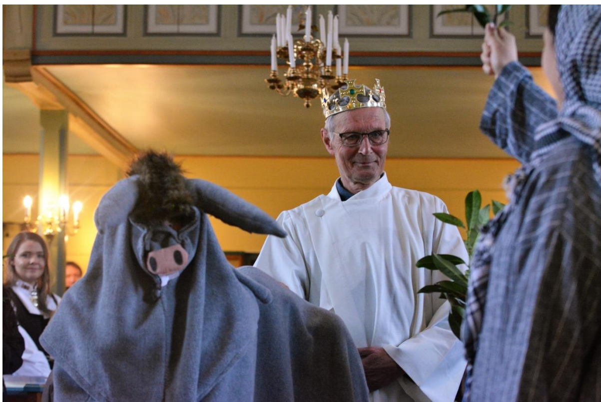
Bilde - 7 Drama på palmesøndag