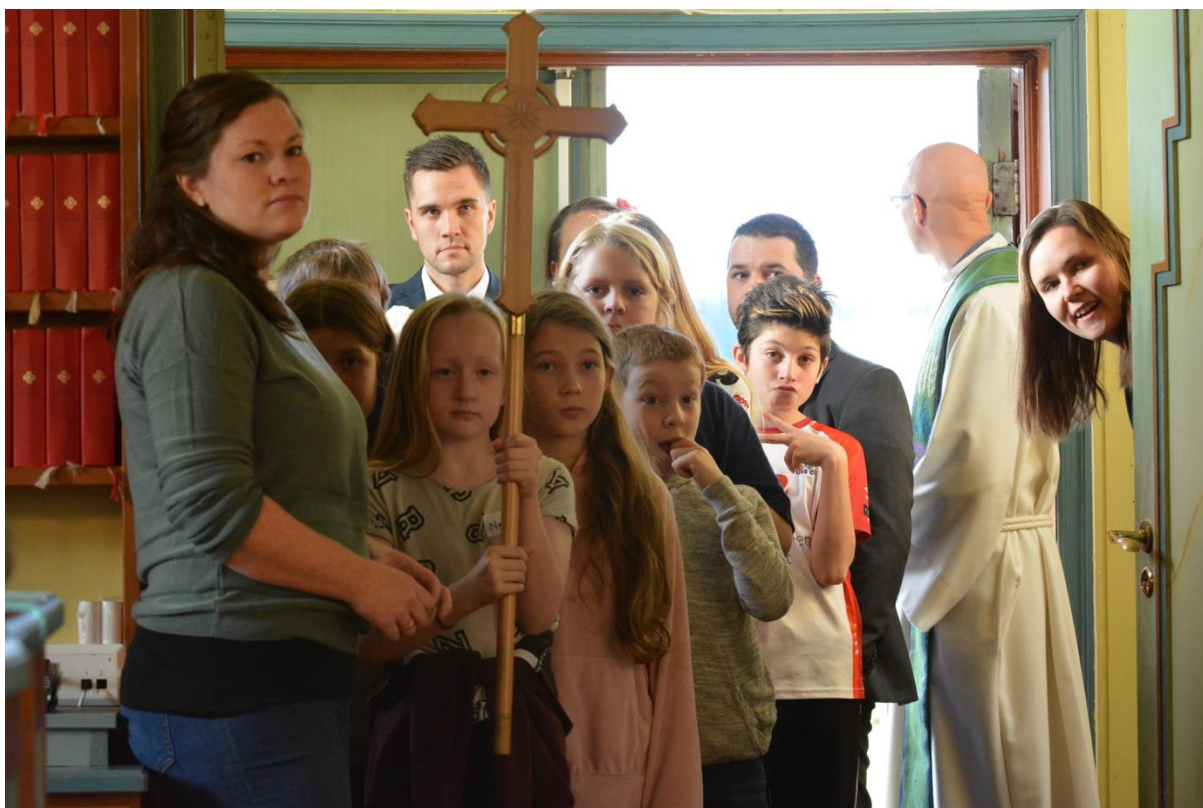
Bilde - 8 Spente barn som får vere med i prosesjon, Lys Vaken