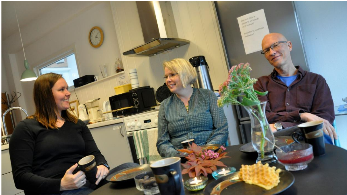
Bilde - 3 Frå intervjuet med Strilen i oktober 2018.