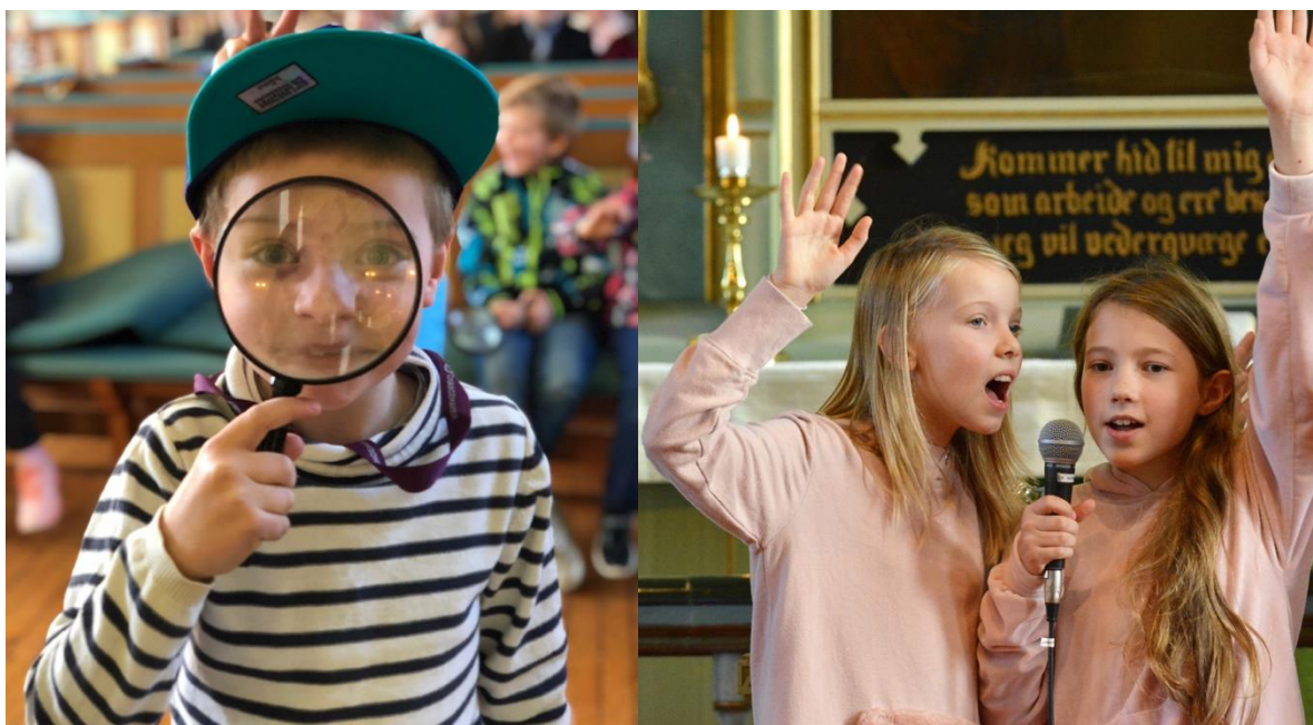
Bilde - 9 – Tårnagent og Lys Vaken-jenter