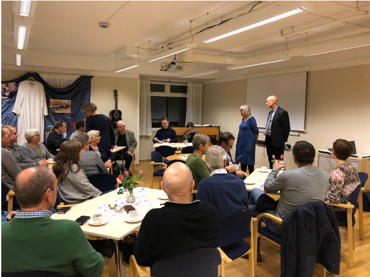
Bilde - 1 - Visjonskveld hausten 2018